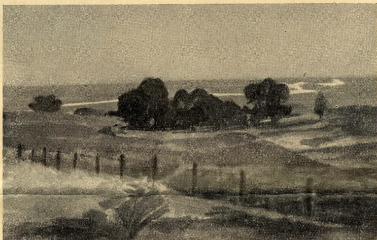
Kilátás a Duna felé.