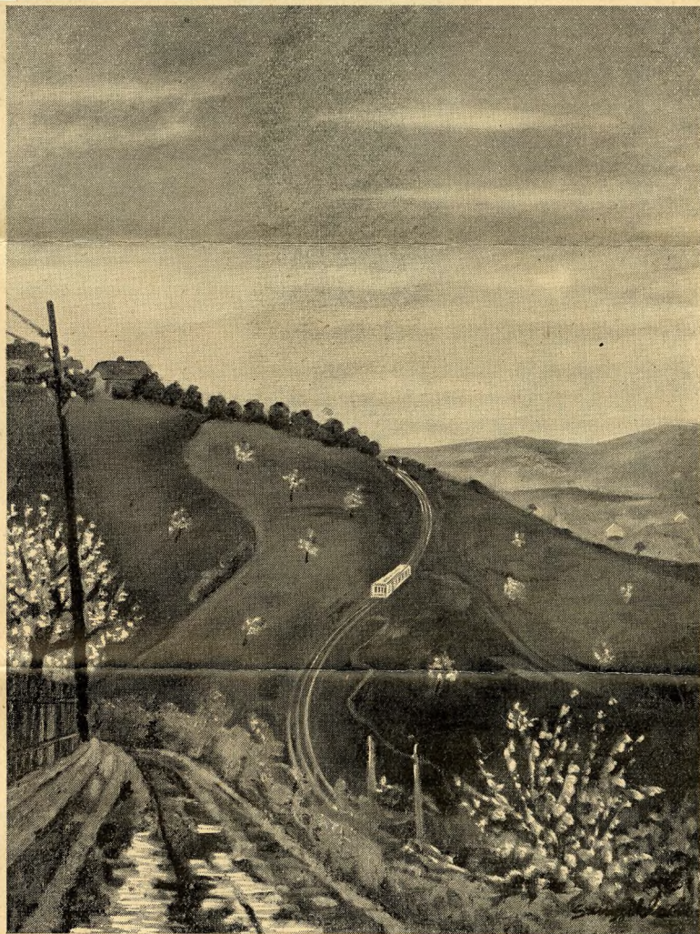
A fogaskerekű (Szigyi Elemér négy aquarellje)

A remete a völgy sötétjét kémleli, a homályos síkságét, melynek fényei a kerti bokrok és fák ágai közt rekedtek meg. Leteszi a könyvet s gondolatai követik a távozó fogaskerekűt, mely kertek és mezők közt ereszkedik egy távoli, immár elérhetetlen és megtagadott város felé. Sötér István