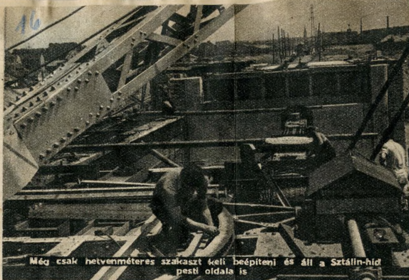
Még csak hetvenméteres szakaszt keli beépíteni és áll a Sztálin-híd pesti oldala is