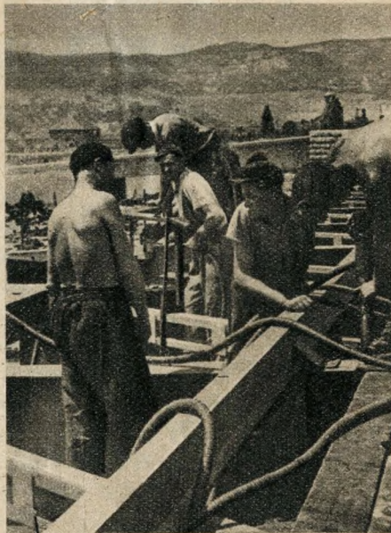
Villanykalapáccsal dolgoznak a szegecselők