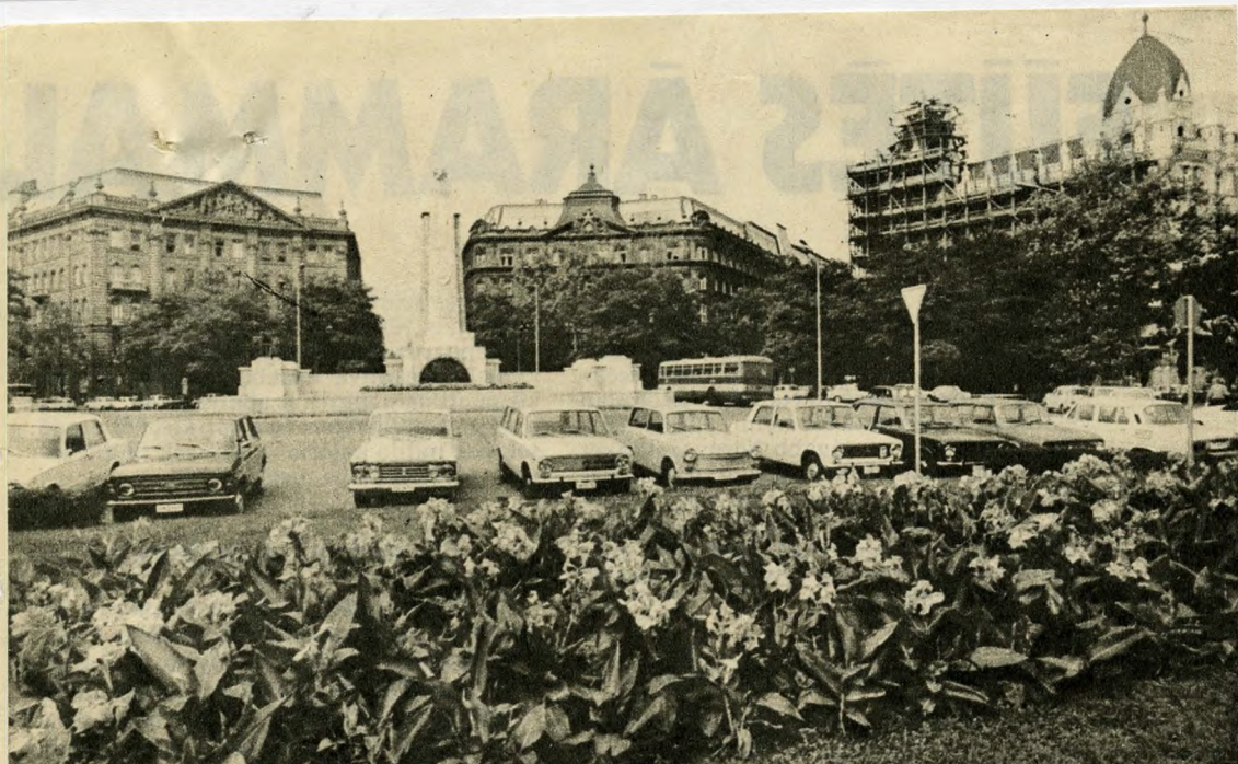
A Szabadság tér dél felől fényképezve

Végül is megért a városrész régen esedékes átépítése: 1890-ben nyilvános rendezési pályázatot hirdettek, s a zsűri egy olyan tervet ajánlott elfogadásra, amely az egész területet sűrűn beépítené. De nem ezt, sőt nem is az első díjast fogadták el megvalósításra; a ma ismert Szabadság teret — a volt Najgebajde helyén — Palóczy Antal építész tanár terve szerint alakították ki. Hibája, hogy a legtöbb térrel ellentétben nem homorú, hanem domború , vagyis a tér a környező házsorok felé lejt, s így azok szinte sülyyedni látszanak.