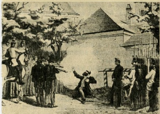
Battyhány kivégzése az Ujépilet északkeleti pavilonjának kapuja előtt (korabeli ábrázolás)