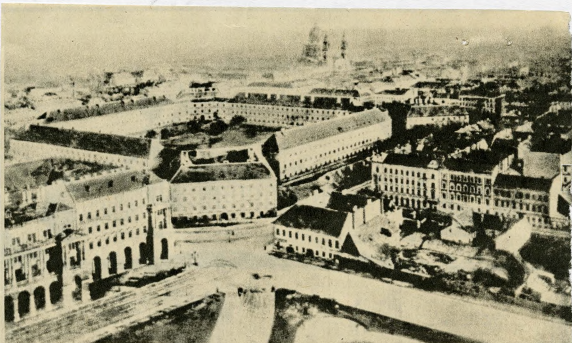
Az Újépület a múlt század végén (a fénykép az akkor épülő Országház tetejéről készült)

volt — csak 1851 tavaszán fogták el, s a Najgebajdéban ítélték el hosszú várfozságra. Ugyancsak ott ítélték el Madách Imrét is, mert egyik íróársát rejtegette. Százával szenvedtek ott hazafiak: 1849 második felében 910 fogoly volt az épületben, de a következő félévben is még 621. Halálos ítéletet 218-at hoztak ott, de csak egy részüket hajtották végre. 1851. szeptember 26-án ott szögezték bitófára a távollétükben elítélt vezetők nevét — utolsónak Kossuth Lajosét.