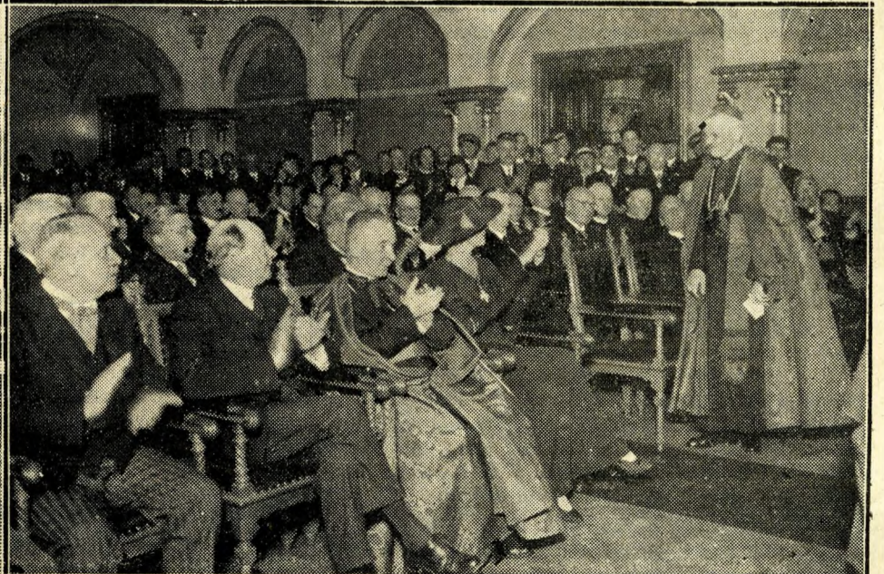
Baloldali kép: Pénteken délután nagy ünnepség keretében történt meg az állam és a főváros által az egyetemnek adományozott tüdőbeteg-klinika alapkövetétele. Képünk: Hóman Bálint kultuszminiszter az első kalapácsütést teszi az alapköre. Jobboldali kép: A Szent István Társulat dísztermében az Emericana ünnepélyes külsőségek között tiszteletbeli főprotektorrá avatta Innitzer Tivadar bácsi bíboros hercegérseket. Képünk: a hercegérsek beszédet mond. Az első sorban ülnek: Anna kir. hercegasszony, Angelo Rotta pápai nuncius, báró Hennet Lipót osztrák követ és Szendy Károly polgármester.