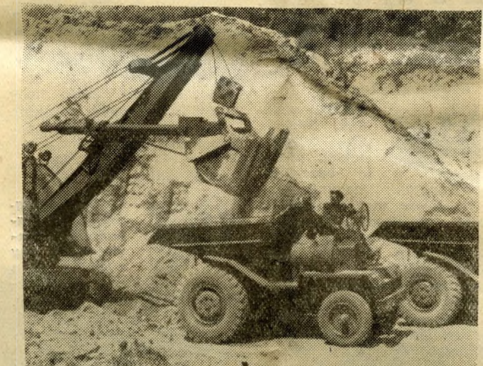
Daka Ernő dömperét ki tudja már hányszor megtölteni az ekskavátor.