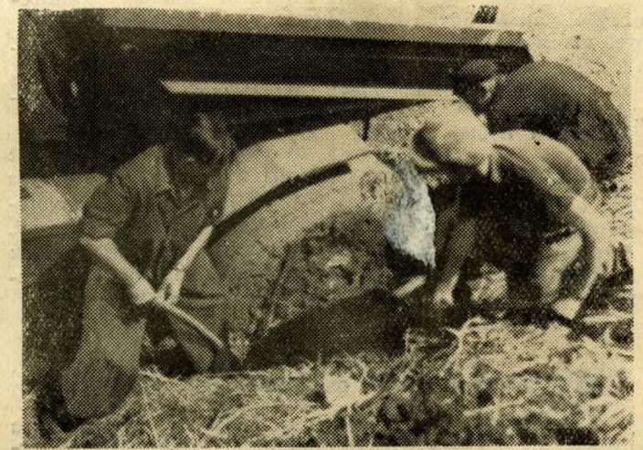
Sok a veszély! Egyesült erővel a gáton az elsüllyedt dömperek kiemelésén is.

Lent a Dunaparton a víz már elérte Pünkösdfürdő pénztárának ablakát. A kerítések tövében honvédeink gyors kezekkel lapátolták az odahordott földet és le is dön-