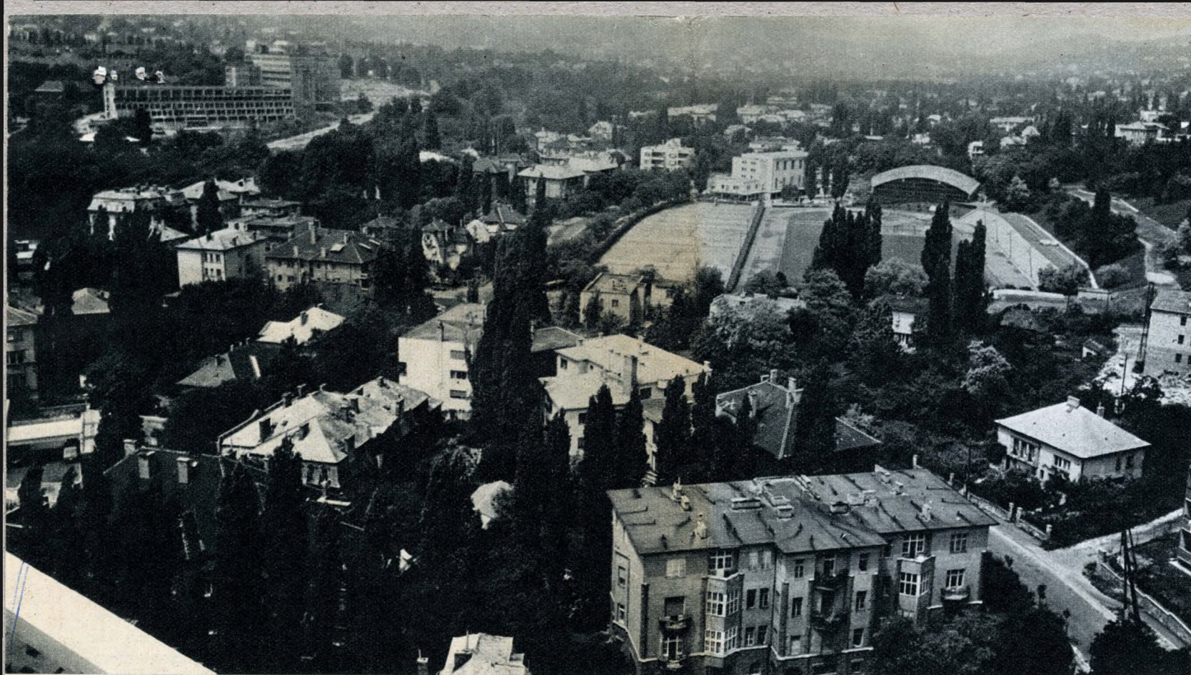
A Vasas pálya környéke