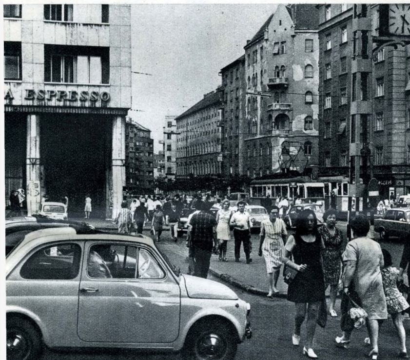
A Mártírok útja