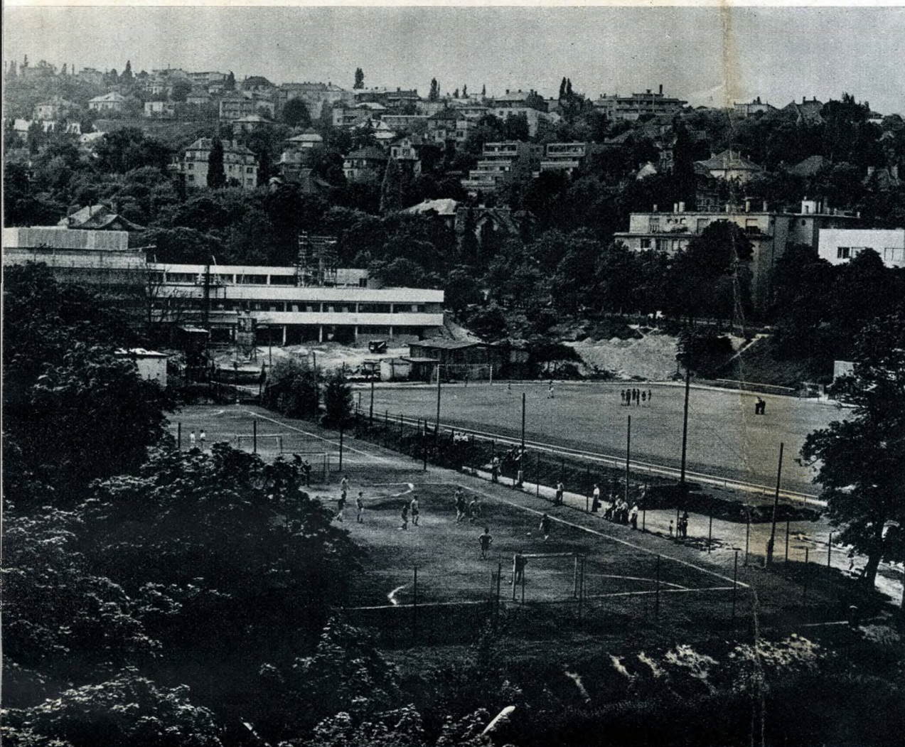
A Marcibányi téri ifjúsági sportpálya és az épülő ifjúsági ház