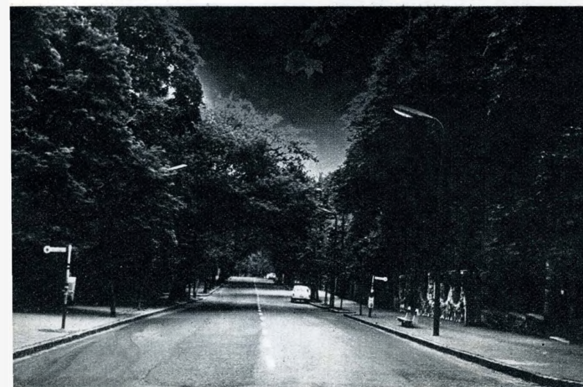
A Rómer Flóris utca