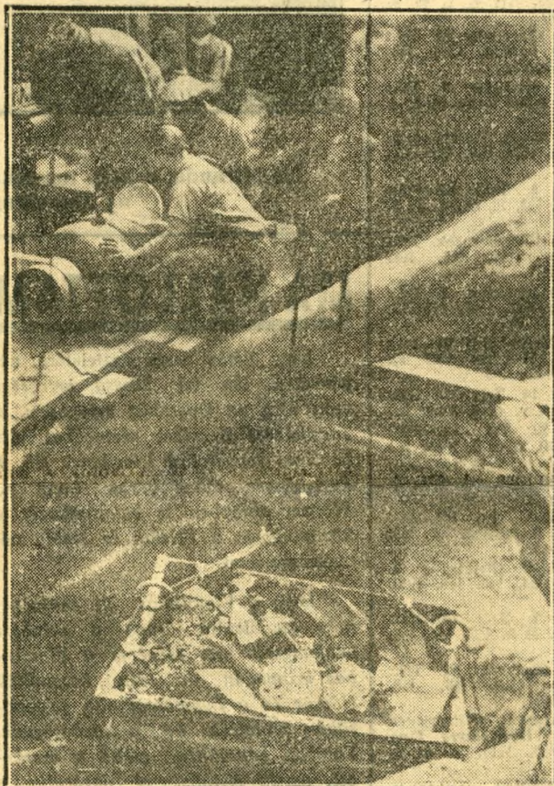
Csillékkal kiemelik a kiásott földet és kötőrmelékkel reflektorok fénye mellett