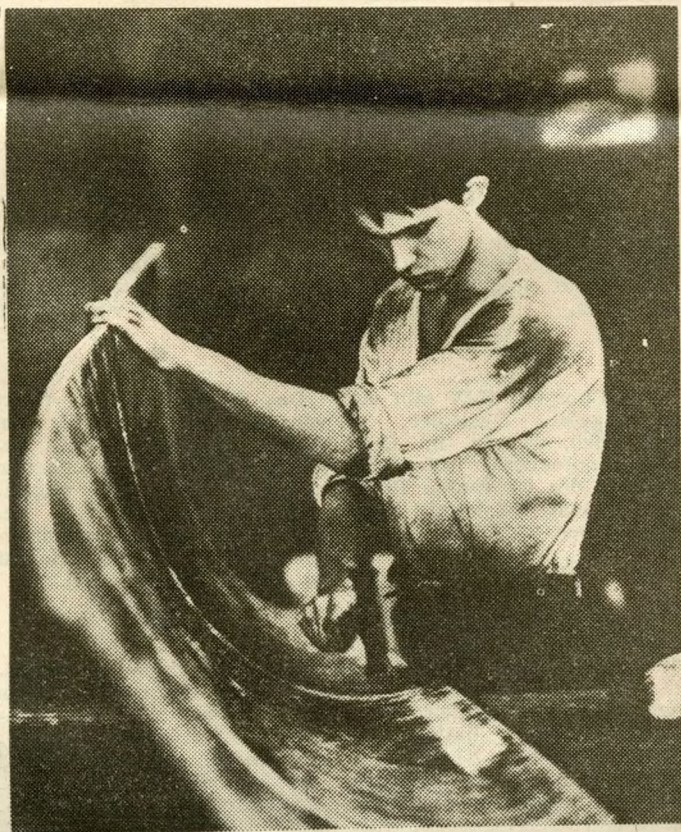
Eisen muß man meistern