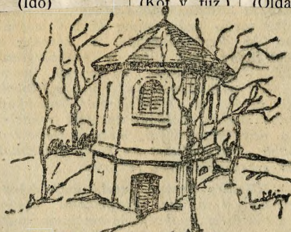
Ahol a 'Tengerszemű hölgy' lakott