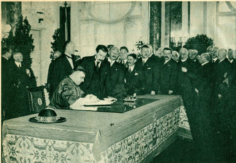
A hercegprimás az Egyetem aulájában aláírja a jubileumi emlékkönyvet, amelyet aztán valamennyi külföldi vendég is aláírt.