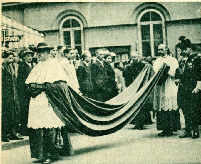
A hercegprimás az Egyetem aulájából az egyetemi templomba vonul.