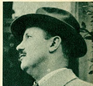
Kermitt Roosevellt, az Egyesült Államok volt elnökének fia, a legnagyobb amerikai hajóosztály elnöke, európai tanulmányútja során Budapestre érkezett.