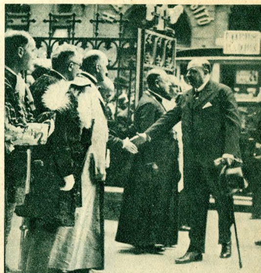
Höman Bálint kultuszminiszter megérkezik az egyetemi templom elé, ahol az Egyetem tanácsa fogadja.