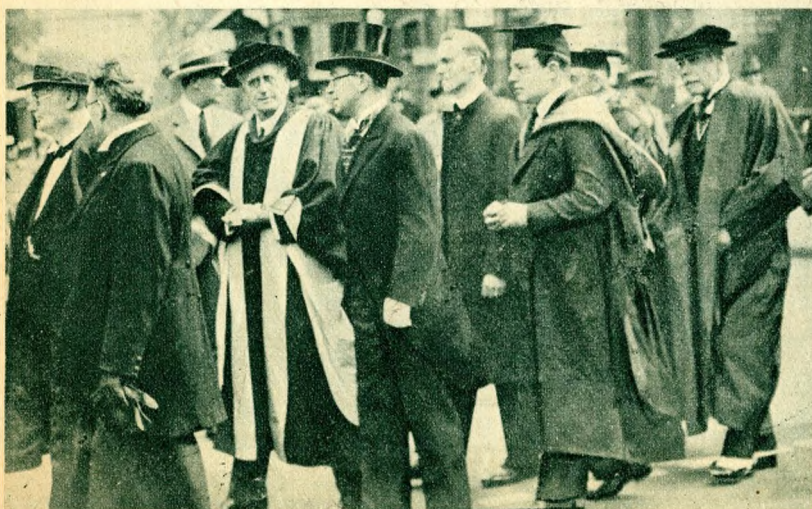
Külföldi egyetemek delegátusai az egyetemi templomba felvonuló menetben.