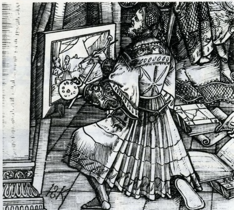
Udvari festő a XV—XVI. század fordulóján. Miksa császár képes életrajzából