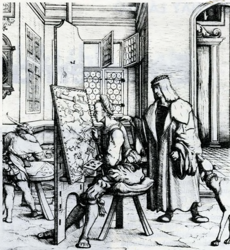
Udvari festő műterme. Hans Burgmayer fametszete. 1510 körül Szemenyei Tivadar reprodukciója

Ha gondolatban felidézünk egy-egy középkori budai palotát, templomot, úgy látjuk, az utcákon, épületeken valósággal tobzódott a szín! Szaktudósok elemzték a budai gótikus szobrok festékanyagait. Cinóber, korom, ólomvegyület, ólomfehér, azurit, arany, réz, ezüst, égetett okker, égetett siena, barna festékanya-