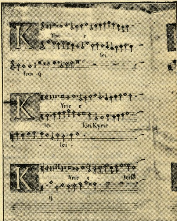
A »Missa Buda Expugnata« kódex első kótaoldala

Minden magyar szívébe kell hogy zárja Si-