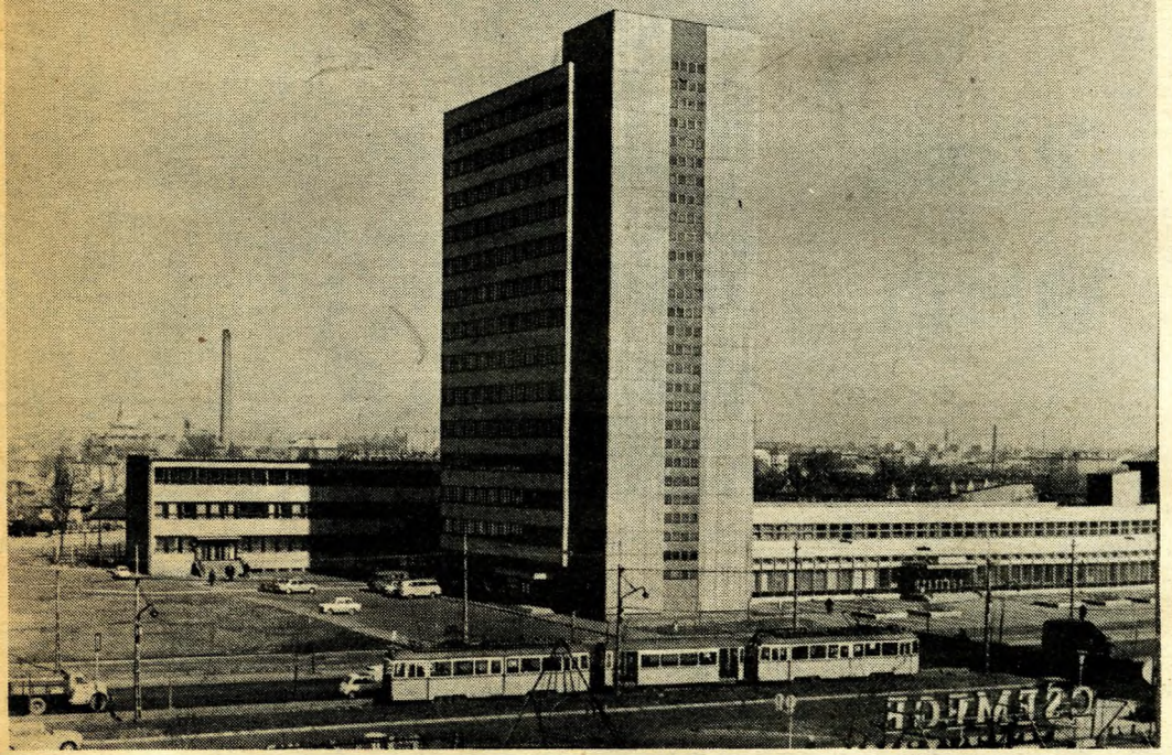
Postapalota a kerület „csücskében”, akár jelképe is lehet Kőbányának, az újjászülött kerületnek

kívánt létesíteni. Ebben a szellemben rendelkezett a Pest, Buda és Óbuda egyesítését kimondó törvénycikk is.