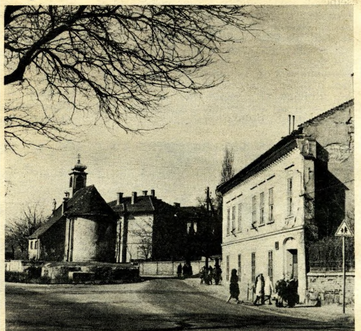
Jellegzetes kőbányai kép: öreg utca a modern városrész szomszédságában

Kőbánya lakossága megközelíti a nyolcvanezretet. Nem a legnagyobb lélekszámú kerülete a fővárosnak, de van egy rekordja: az állami ipar üzemében több, mint 71 ezer dolgozót foglalkoztatnak. Ha ehhez hozzávesszük a mezőgazdaságban, a kereskedelem, a közigazgatásban és egyéb szellemi munkaterületen alkalmazottakat, akkor a kőbányai dolgozók száma meghaladja a százezretet. Kőbánya Alsó és Felső vasútállomáson szolgálatot teljesítő vasutasok a megmondható, hogy mennyien szállnak le a vonatokról, akik Nagykátáról, Ceglédbercelről, Mendé-