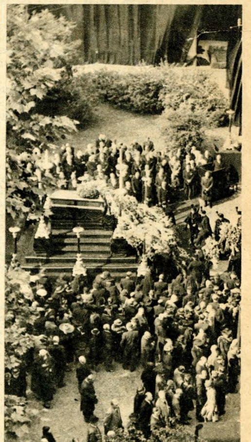
A temetés a városháza udvaráról