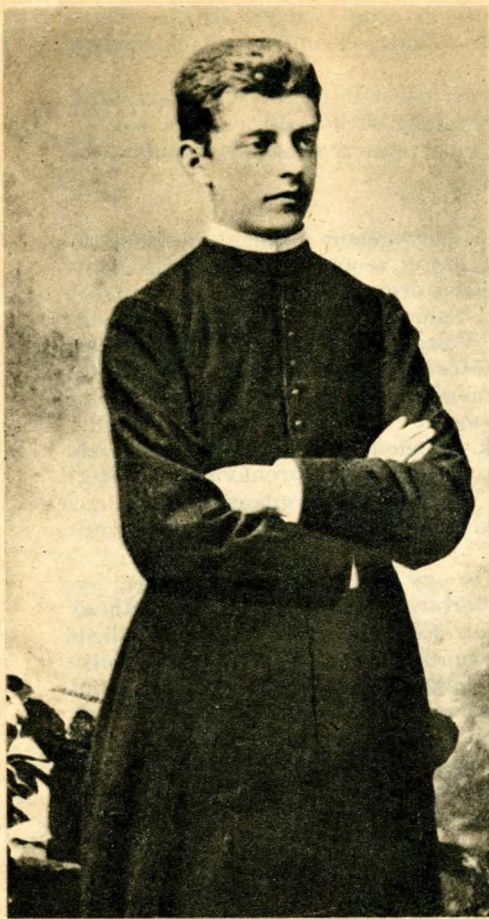
Amikor még papnak készült