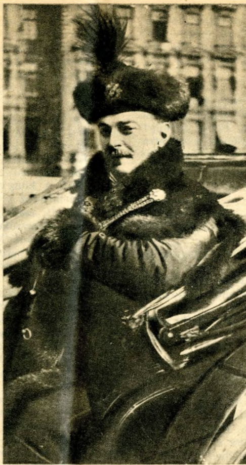
Mint fiatal polgármester. Korabeli bécsi levelezőlap