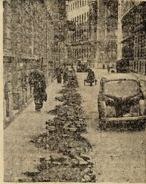
A IX., Mátyás-utcában ilyen hosszú szakaszon otthagya a hibás köveket, törmelékét az Ut-építő Vállalat. Ez csak négy kép egy köztisztasá-gi ellenőr egynapi útjából. De még sokkal több a hiba. Pedig a tisztaságért nemcsak az ellen-őröknek kell küzdeni.