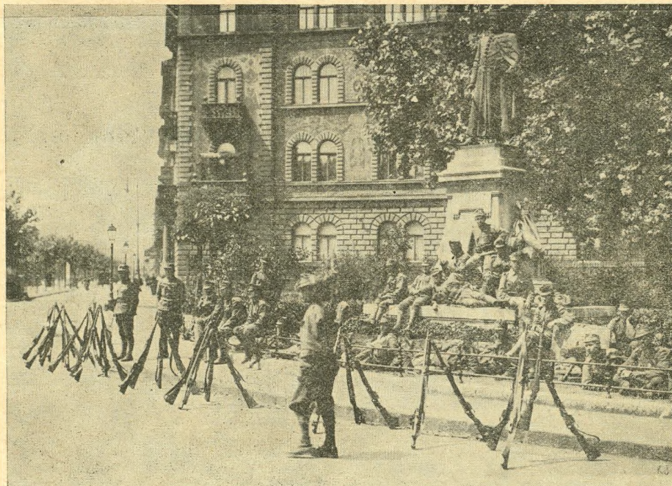
10-es honvédek a Köröndön. 1918 július

Az „épületek” fejezetben belül külön csoportokba kerültek a középületek és a