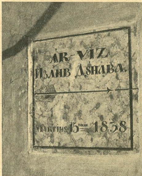
Magyar és görög feliratos márványtábla jelzi az 1838-as árvíz szintjét egy budai ház falán

Néhány éven belül azonban kialakult a gyarapítás legcélszerűbb módszere. Már kezdetben egyik fontos beszerzési forrás volt a magánosoknál meghúzódó családi fényképgyűjtemény. Hirdetések útján tekintélyes számú múlt századi felvétel — többségük arckép — került birtokunkba. Sok esetben a képen szereplő személy azonosítása is lehetetlen volt, a felvételek