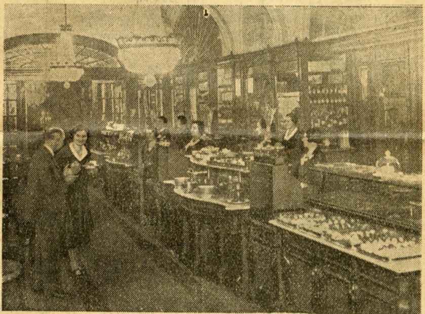
Une pâtisserie célèbre de Budapest.

— Vous dites, déclarent-ils, que ces terres habitées par les Roumains ou les Serbes sont roumaines ou yougoslaves. Mais pas du tout. Elles sont hongroises en dépit de leur population étrangère. Les Balkaniques fuyant les Turcs sont venus chercher refuge chez nous. Nous les y avons accueillis comme des frères opprimés. Et aujourd'hui, ils avancent : « La maison est à nous, c'est à vous d'en sortir ! » Est-ce juste ?