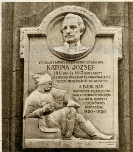
Katona József emléktábla a Szentkirályi utcában

A végére hagyjuk a magyar regösök, zsurnaliszták, nótaszerzők, vándordíjakok és lá-