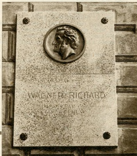
Wagner Richard emléktáblája a Türr István utcában