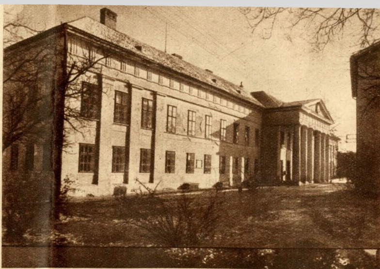
A régi szekszárdi megyeháza főhomlokzata

A most említett bérházfejlődésnek egyik legszebb és legérettebb példája a családja számára épített, eredetileg kétemeletes bérház a mai József Attila utca sarkán. Az 1822-ben tervezett ház főbejárata tágas, négyzet alakú előcsarnokba vezet, amelynek cselegyék és dongák bonyolult együtteséből alkotott boltozata négy dór oszlopon nyugszik. Ezután téglányalakú, tágas és világos szakasz következik, amely a bejárati tengelyben az udvarra, az erre merőleges tengelyben a félkör alakú lépcsőházra nyílik. Ugyanilyen mesteri egyszerűség és biztonság mutatkozik a homlokzat képzésében is: az alig kiemelt két szélső rizalitot a főhom-