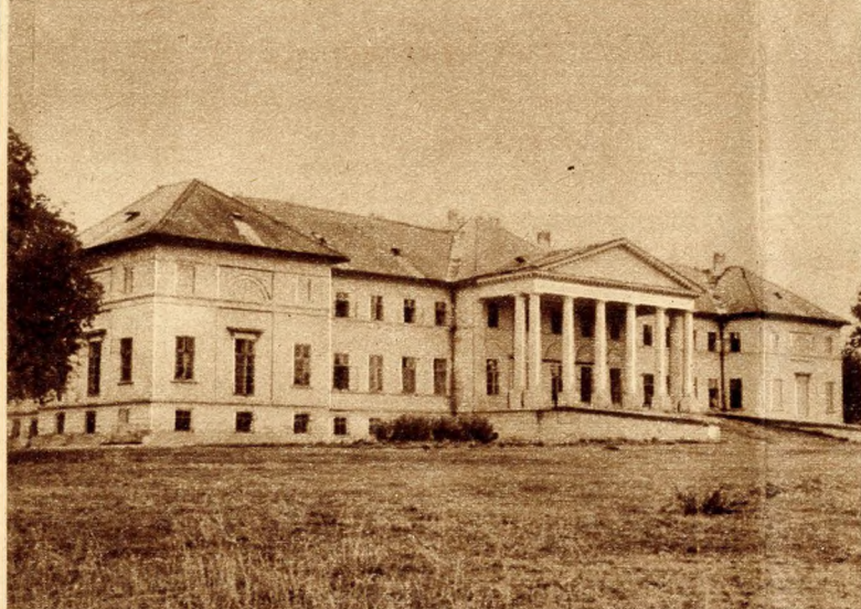
Az egykori Festetich-kastély kerti homlokzata Dégen

céhbeli építész, aki e körülmények közt hazánkba érkezik, Hild János volt. A francia származású Canevale kivitelező építészeként jön Vácra, hogy a székesegyház és a diadalív munkálatait vezesse, majd utána a sok ellenszennvel fogadott pesti Újépületet építse. Az öt követő többi mester is mind céhneveltetésben részesült, gyakorlati-polgári építkezéseken nőtt fel.