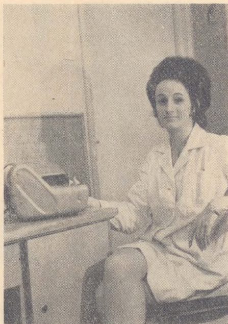
Mini-Graph készülékkel sokszorosítják a katalóguscédulákat

Az olvasótermi helyiség belső magassága galéria építését tette lehetővé, és így