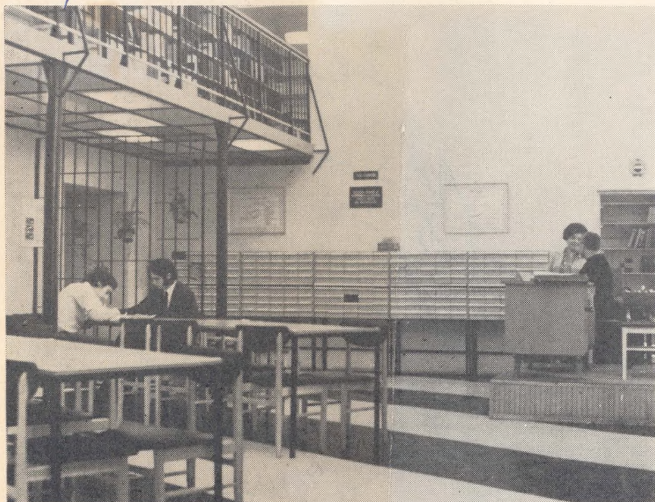
Az Eötvös Loránd Tudományegyetem Jogi Kari Könyvtárának galériás olvasóterme (Cikkünket ld. a 270. oldalon)