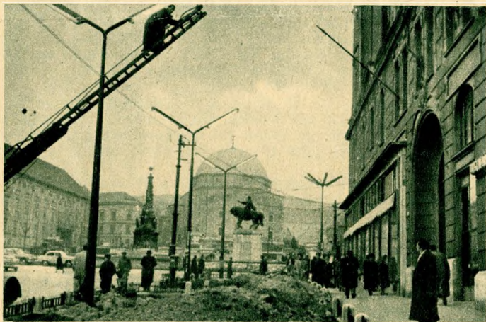
Pécsett az elmúlt év folyamán fokozatosan bevezették a főútvonalakon a fénycső-világítást. A városban a közelmúltban fejezték be az új világítás szerelését, s így Pécs összes főútvonalait ma már korszerű „fénycsőgalutak” világítják meg