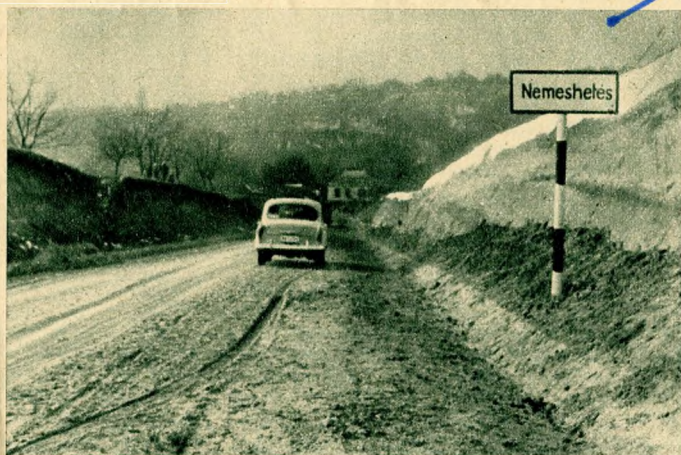
Három kilométer hosszú bekötőutat kapott Nemesheles, a zalai hegyek közé épült több száz éves kisközség. Lakói eddig csak egyetlen rossz bekötőúton tudtak kapcsolatot teremteni a külvilággal. S most az új úton valószínűleg távolsági autóbusszjáratot is indítanak...

Egy otffelejtt irányjelző tábla a Szabadság téren. Evekkel ezelőtt, amikor a Technika Háza mellett az építkezések miatt a forgalmat lezárták, irányjelző táblát helyeztek el a Bajcsy-Zsilinszky út felől a tér közepére tartó gépjárművek részére, mivel abban az időben az Október 6 utca csak egyirányú volt, tehát jobbra kellett fordulni a szovjet emlékmű felé. Hónapokkal ezelőtt az Október 6 utcát kétirányúnak minősítették, s a Technika Háza melletti útszakasz is felszabadult