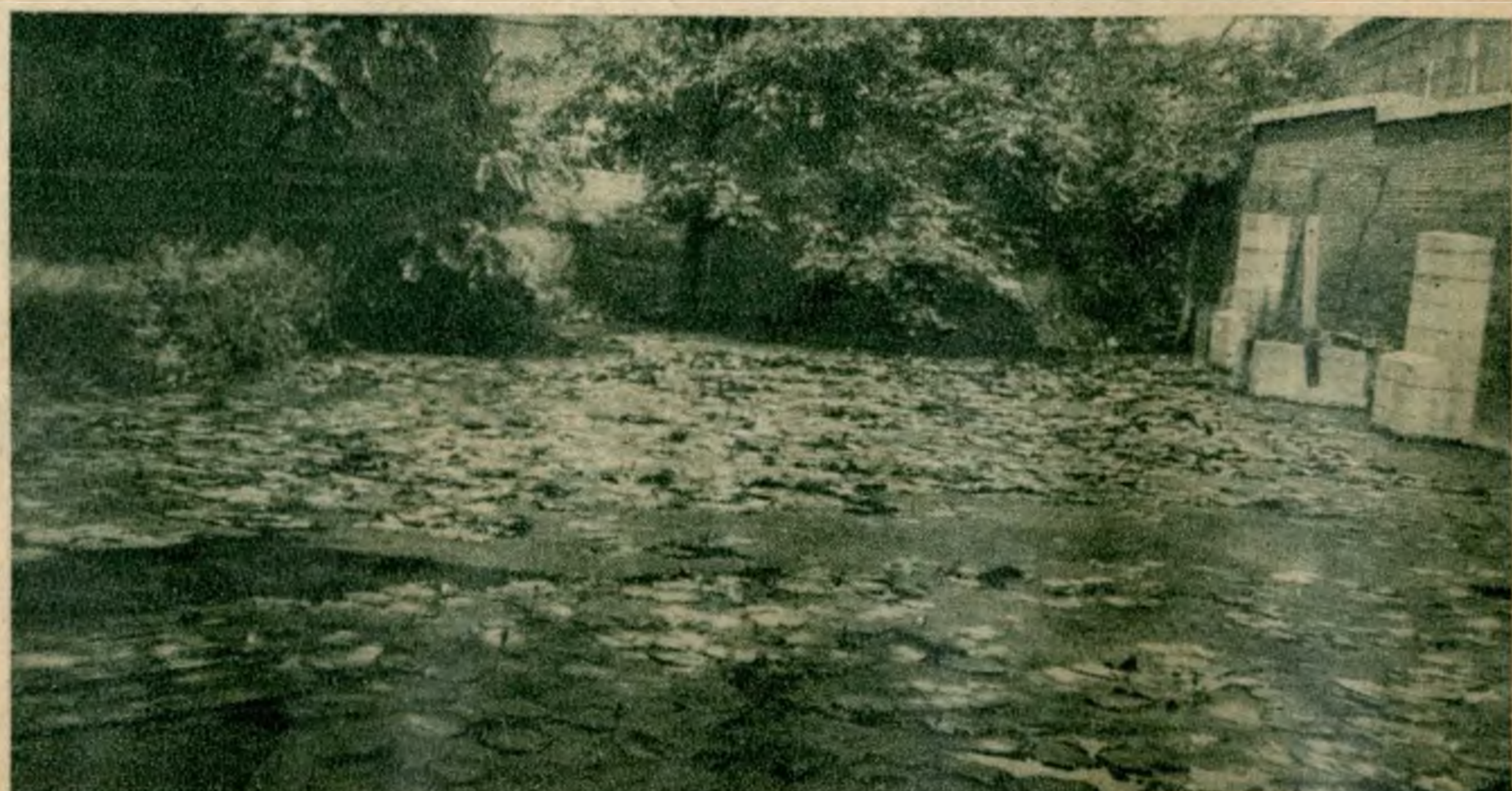
A lótuszvirágok tava.