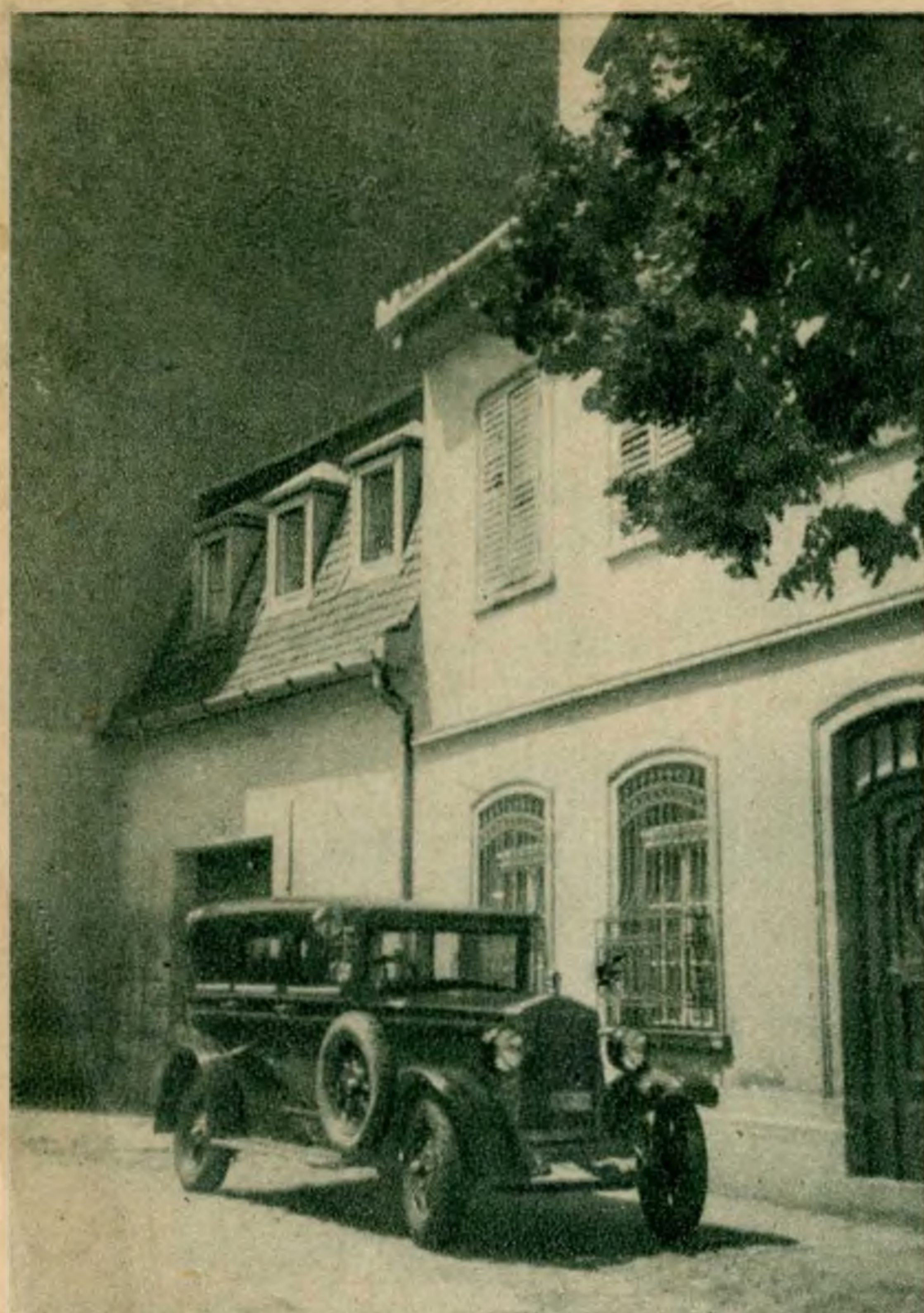
Mult és jelen.