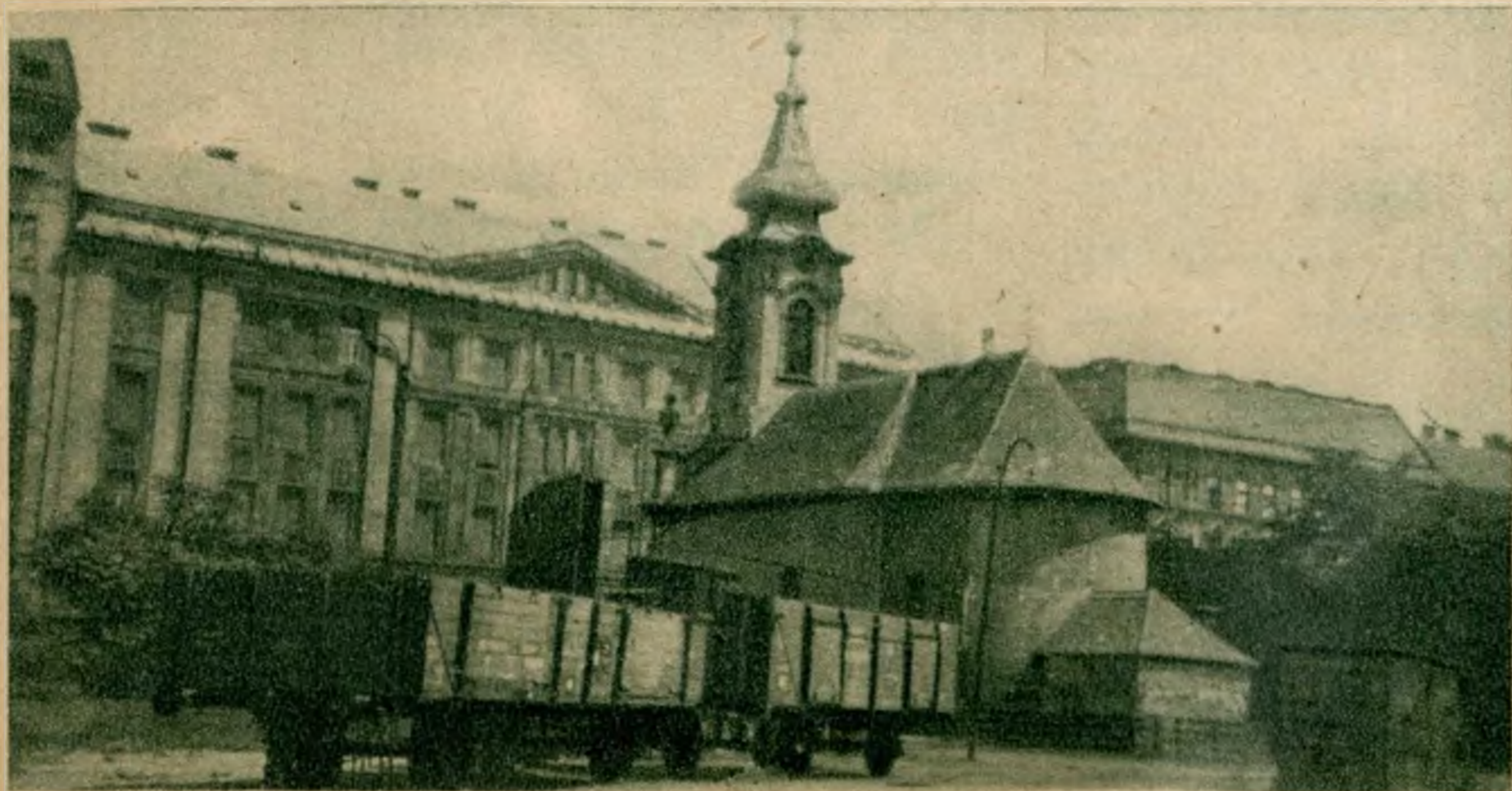
A Flórián-templom, udvarán a vagonokkal.