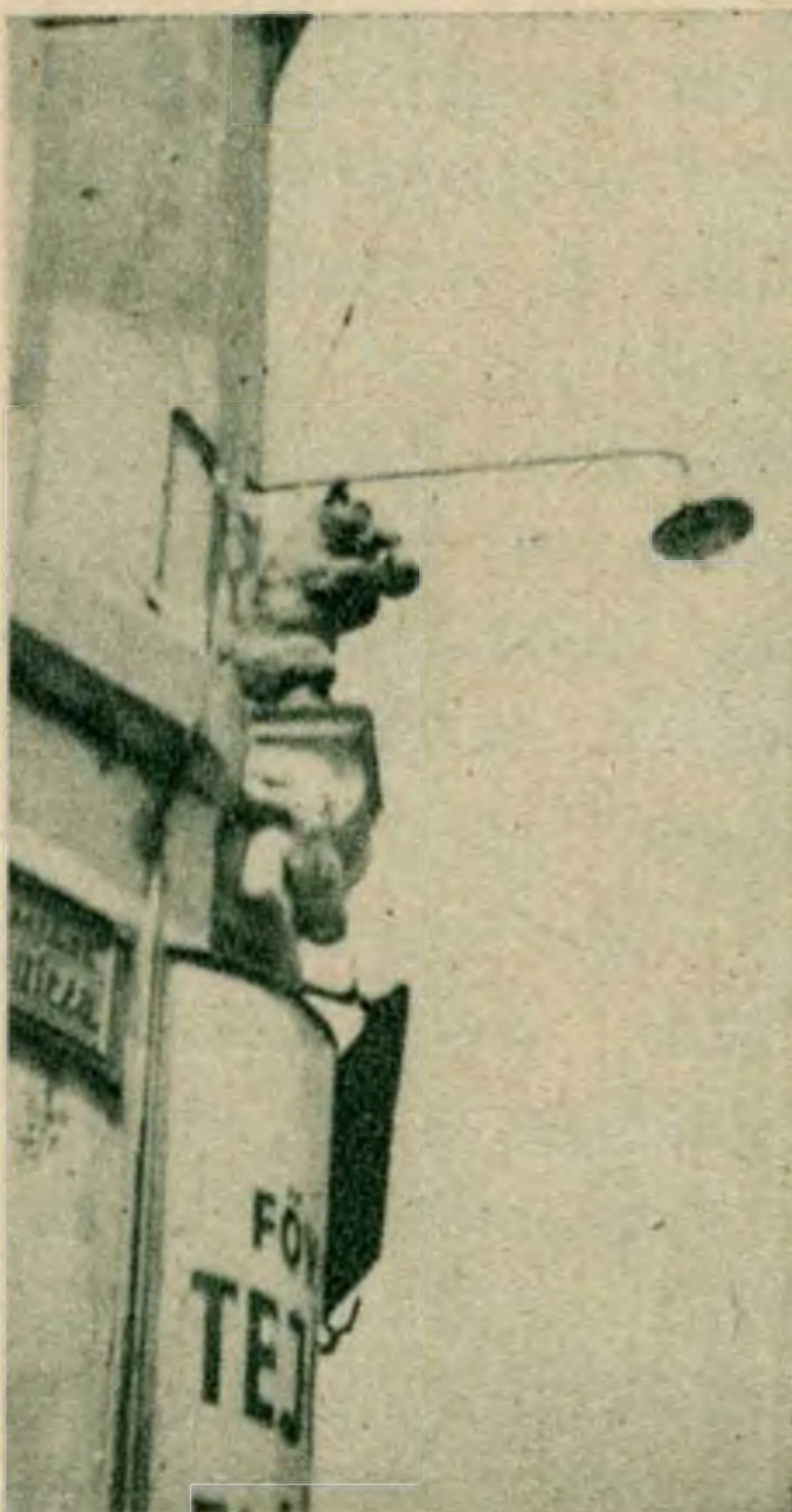
A Medve-utca címere.