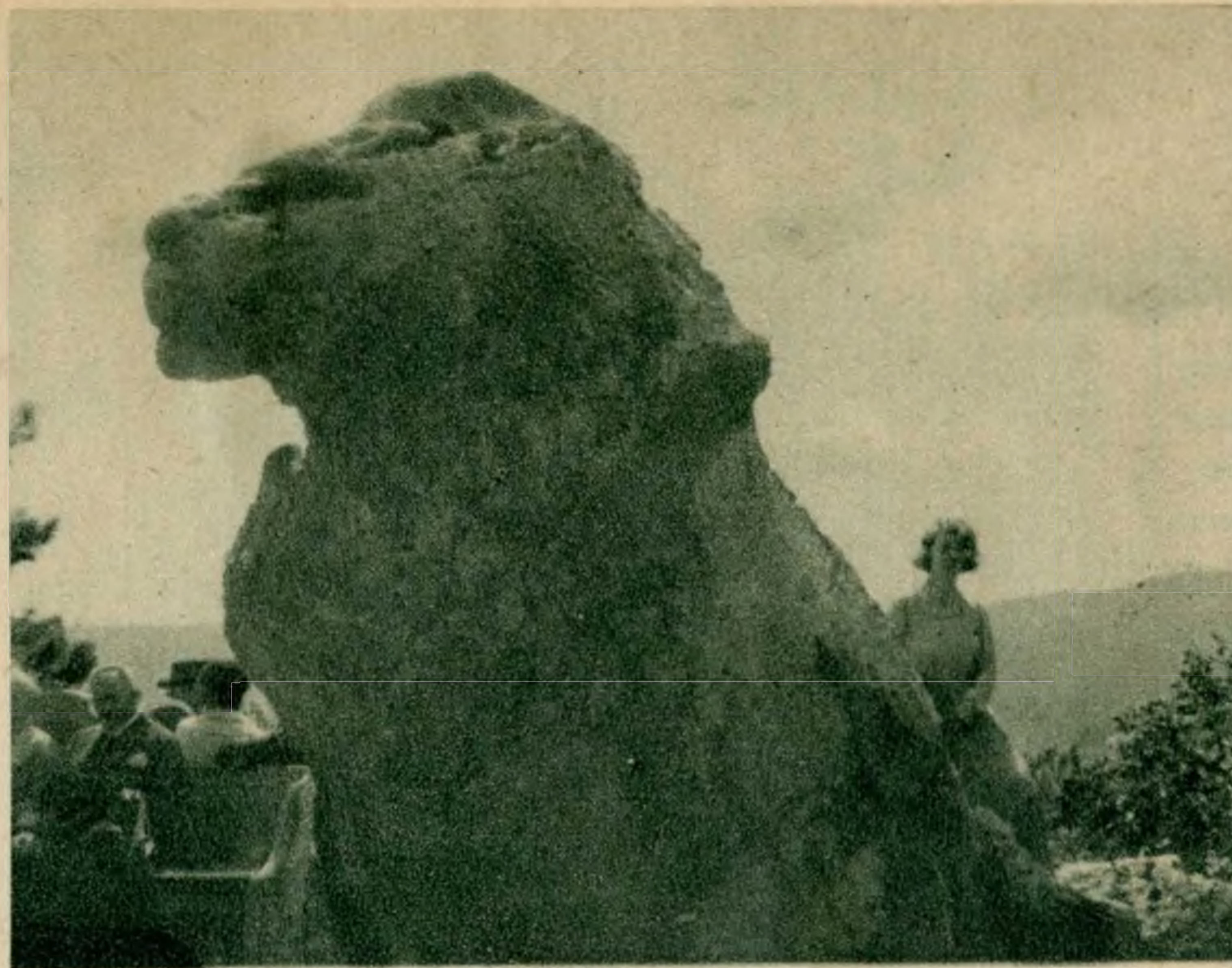
A gugerhegyi oroszlán.