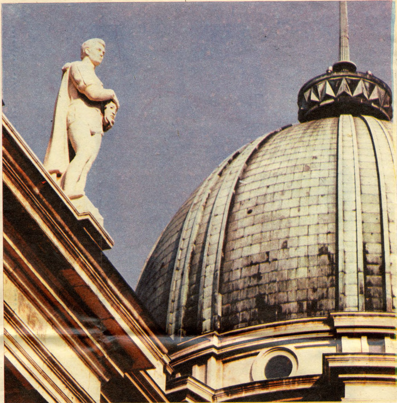
Színészet, Fekete Géza allegorikus szobra az Oroszlános udvarban

Ilyen környezetben a kávé is jobban esik