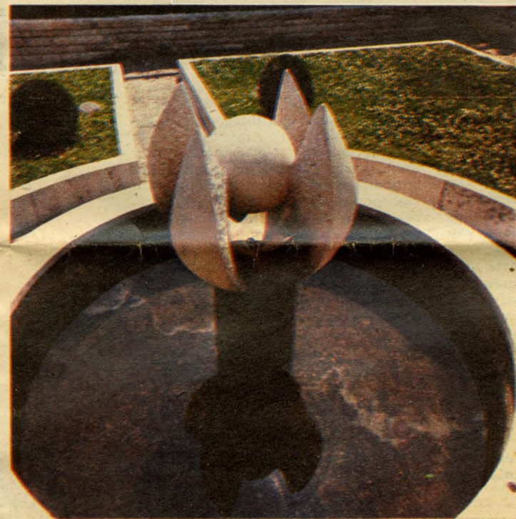
Es egy kis 20. század, Borsos Miklós kútja