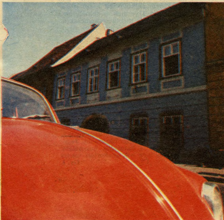
Színek és korszakok játéka