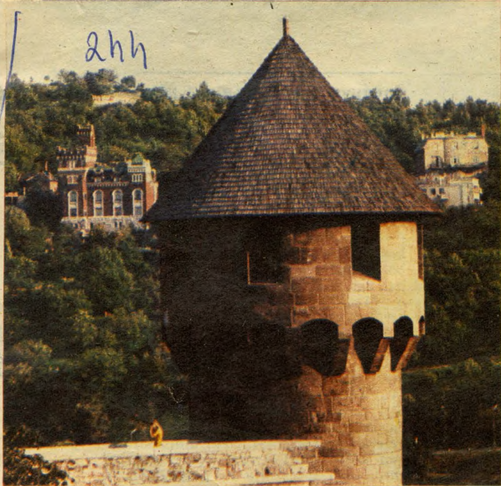
Hát lehet ezt a kilátást megenni?