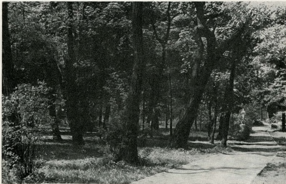
5. Megmaradt öreg facsoport

A Felszabadulás után a Ludovikát felváltó Kossuth Akadémia is megszűnik, a fennállása óta egységes kezelésben levő park és intézmény széjjelesik. A mérleg a gazdasági érvek oldalára billen a kert és az épülettömbök sorsának meghatározásánál. A háború előtti Orczy kert — az épületek nélkül — 23 hektárnyi parkterületet jelentett, most alig 14 hektárról beszélhetünk, de az is veszélyeztetettnek látszik.