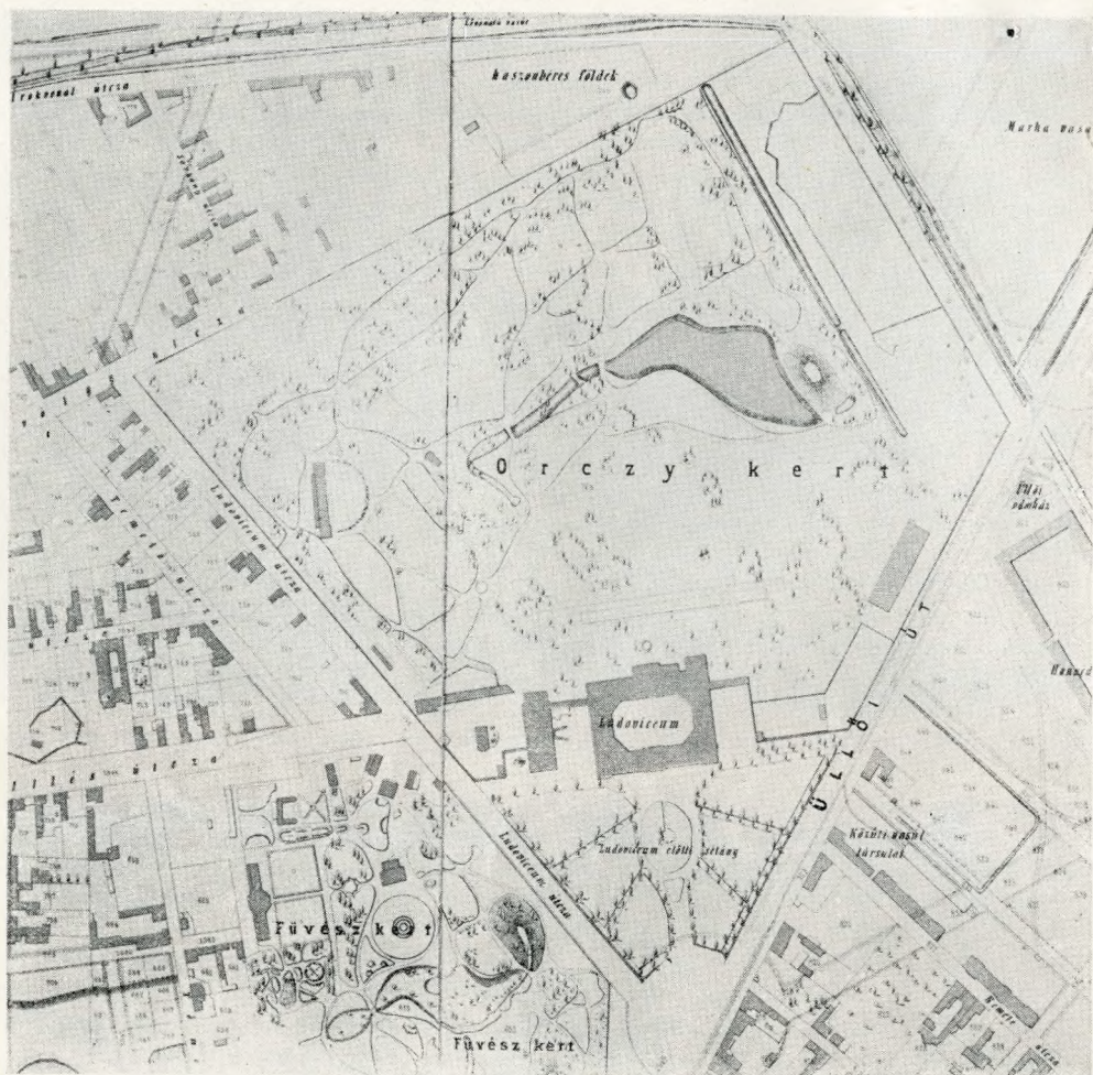
4. Az Orczy kert (Halácsy Sándor térképének részlete 1873.)

készületek csak 1826-ban kezdődnek meg. Az Orczy család telekkomplexumát átadja az intézmény részére. 1830-ban elkezdődik az építkezés, Pollák Mihály tervei alapján. A hatalmas főépület hamar tető alá kerül, de sokáig nem szolgálhatja rendeltetését. Hol raktár, hol kórház, kisegítőképpen múzeum, az 1836-os árvíz alatt sok száz család menedékhelye. Ez idő tájt alakul ki a park máig érvényes (sajnos kissé elméleti) határvonala. — A park fénykorának vége. Az Orczy család a narancsház, az egzoták jó részét elszállítja, a park szegényedik, a fenntartás szűkebb keretek közé szorul.