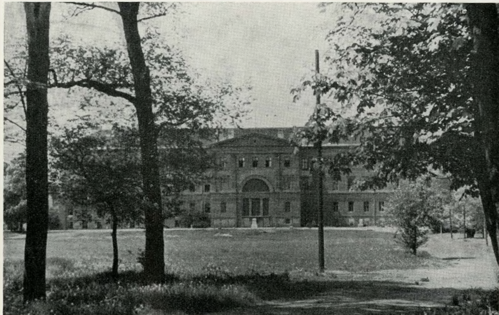
2. A park utcai részlete

A francia barokk-kert visszahatása az egyszerűsége és a természet utánzására törekvő angol kertet hozza divatba. Rétszerű sima pázsit lép a cikornyás díszű parterre helyébe, ligetes facsoport váltja fel az alakított, a nyírott növényfalat, szabálytalan víztűkőr a geometrikus medencét vagy csatornát — kígyózó útvezetés a nyilegyenes allékat. A kor ízlését azonban nem soká elégíti ki a kert ezen szerény formája — a tájkeret népies eredetre utaló építménnyel, majorsági épülettel, malommal, istállóval díszítik. Ismét a francia udvart utánozva : XVI. Lajos trianoni kastélyparkját, majd a londoni Kew Garden botanikus kertjének pagodáját és mecsetjét, a keleti és egzotikus díszítő elemeket, amelyhez további romantikus elemek csatlakoznak. Kialakul a korra jellemző szentimentális angol kert stílusa, és Petri révén hozzánk is elkerül! Kísérjük figyelemmel a kertet, és kövessük Petrinek, a kert első krónikásának leírását. A tervező lelkesen tolmácsolt elgondolását az idő igazolja : az Orczy kert évtizedeken át olyan, ahogy azt a tervező megálmodta.