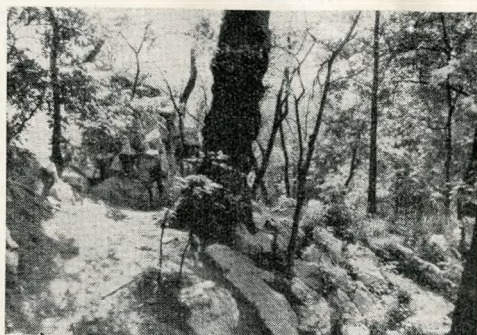
7. Régi műszikla és barlang maradványai

Különbéféle intézmények és üzemek foglalják el a meglévő épületeket, újak épülnek . . . A parkot kerítés vágja részekre, az alig kezelt középső térséghez sporttelep csatlakozik, ahol lelkesedéssel, de gyenge felkészültséggel védik a park jellegét . . . Az összetartozó területnek legalább 12 gazdája alig biztosíthatja a park egységét és minimális kezelését . . .