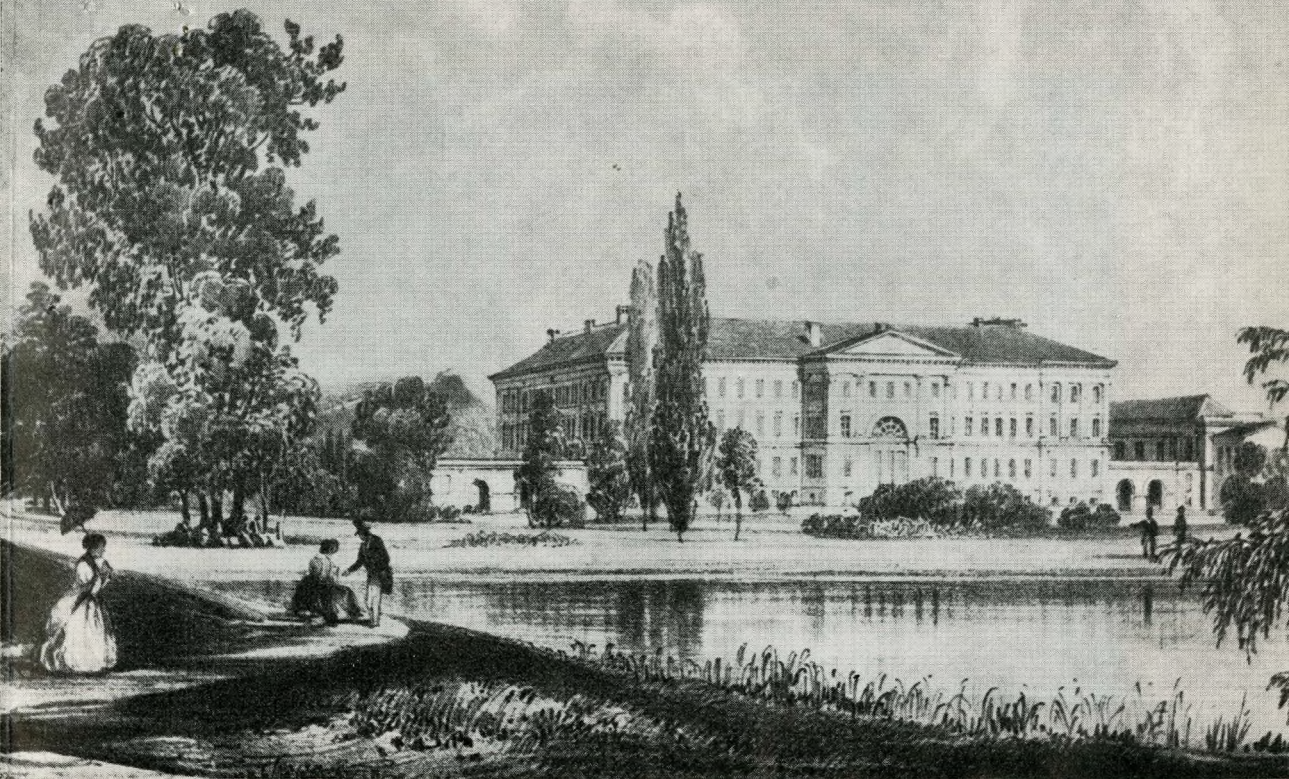
1. Alt Rudolf metszete (1845) a Ludoviceum kertjével