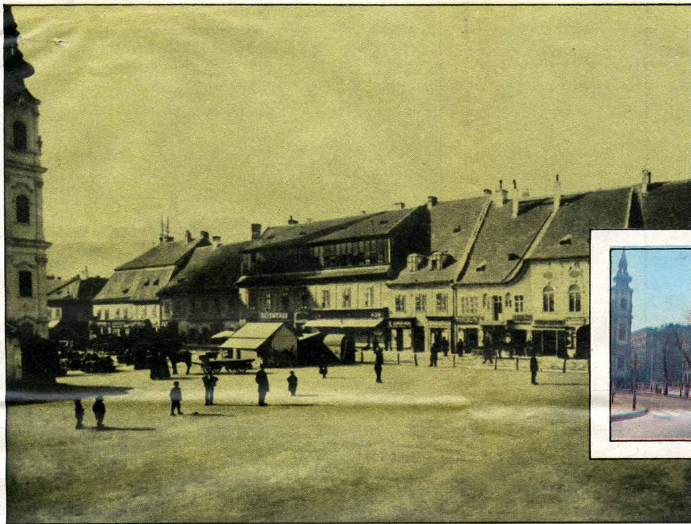
A Bomba (Batthyány) tér akkoriban piactér volt, a kép bal oldalán a Szt. Anna-templom tornya 1895 körül.