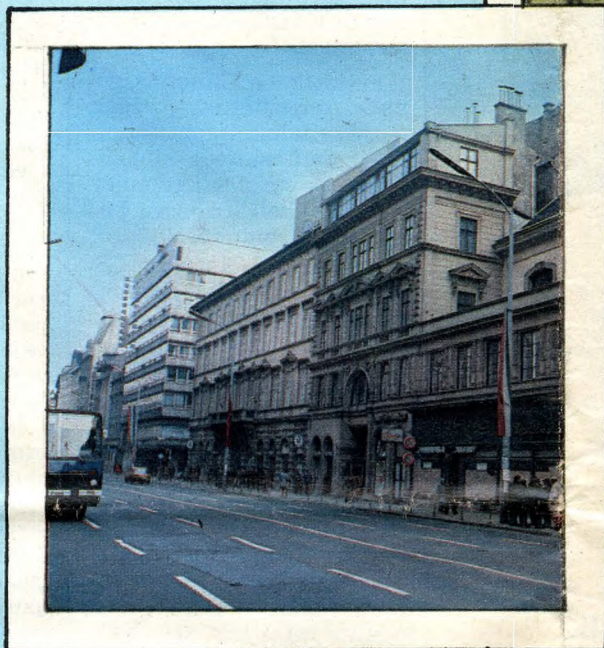
244 Klöz György műterme a Belvárosban, a Hatvani (Kossuth Lajos) utca 1. szám alatt, a Ferences-templom mellett; 1890-es évek