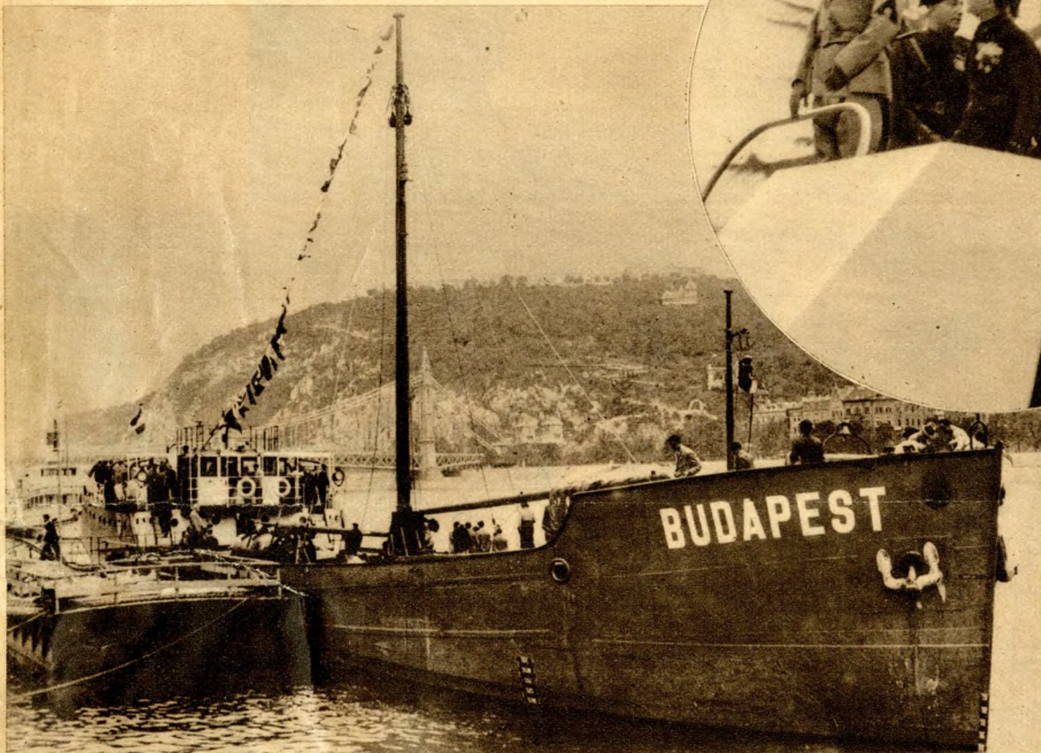
A „Budapest” tengerjáró első tengeri útjára indul.