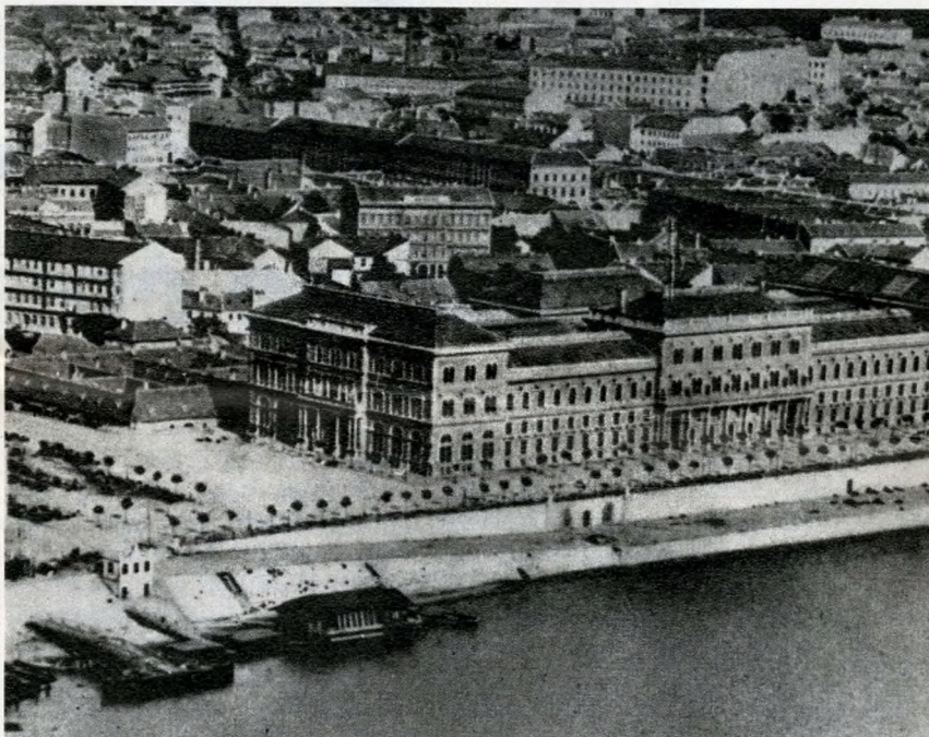
Jól érzékelhető a szintkülönbség: a Várház (ma Közgazdaságtudományi Egyetem) mögött, balra a Sóház alig látszik ki a földből

méttelep fölé. Később a várospolitikai szeméttel betemetett gödröket felhasználta, sőt városépítési célokra egyenesen számításba vette; ezzel a folyamatos szeméttelhelyezést és feltöltést a városrendezés szolgálatába állította.