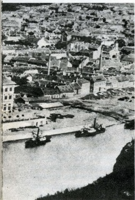
Jenei István reprodukciói