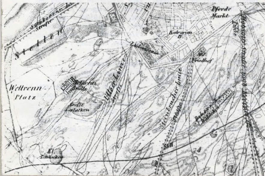
Régi térképek a IX. kerületről, ahol később a tavak helyén szemétteltelepet létesítettek

A lakosság — miután a városokban már korlátozták a szemétkerakást — a városfalakon át dobálta ki a hulladékot ezért az a falak közvetlen köze,