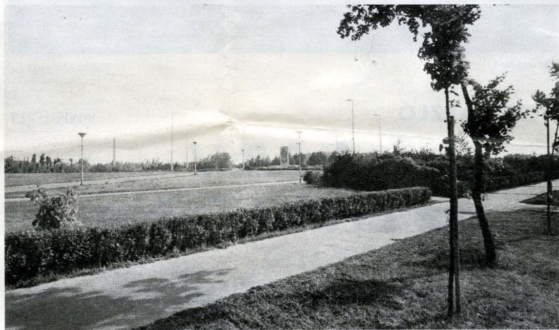
Feltöltéssel hozták létre a Kőbányai Jubileumi parkot

Nagykőrösi út) között, illetve a határ mentén tavakat látunk, Nádastó, Sóstó, Fizértó és Füz-kút elnevezéssel.