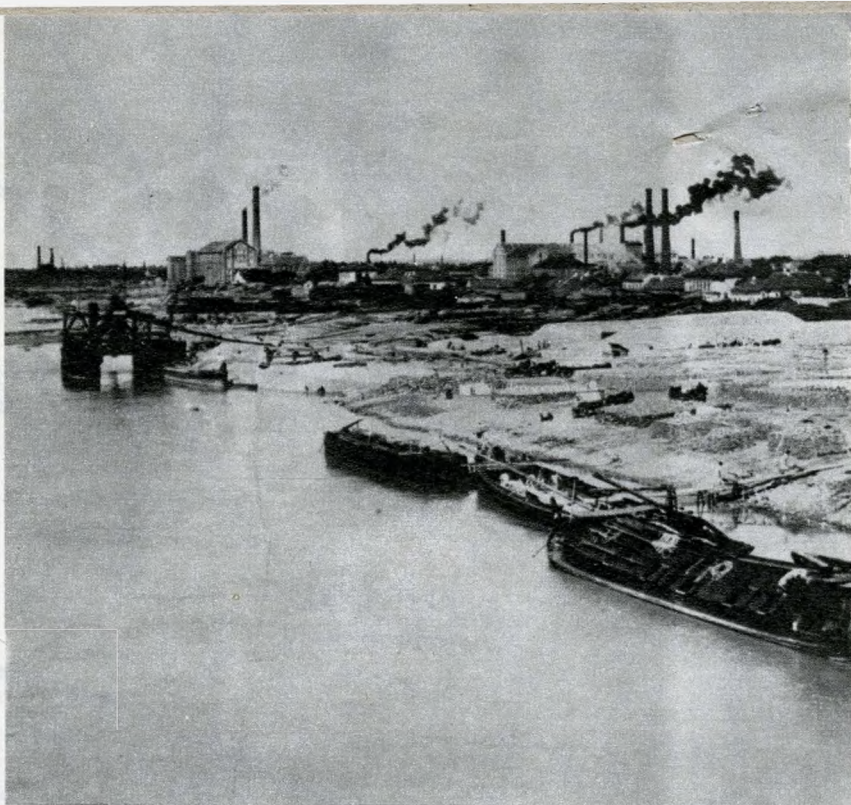
Az Újpesti rakpart fényképe (1890 körül)

A városok terjedésével és a beépített területek növekedésével a szemetlerakó helyek bekerültek a város belsejébe. A helyszűke miatt a már feltöltött és teljesen betemetett szemetlerakókra is elkezdtek építkezni. Eleinte kis viskókat, később már házakat, sőt egész városrészeket építettek a sze-