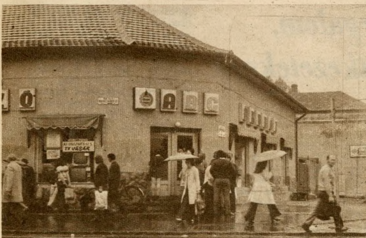
A csillaghegyi ABC-áruház