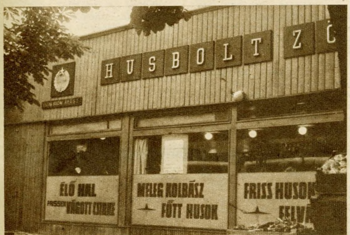
A Budagyöngye piaci húsbolt