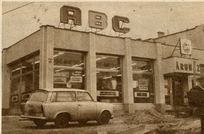
A Pusztaszeri úti ABC-áruház külső képe, ahol még egy eszpresszót is létesítenek