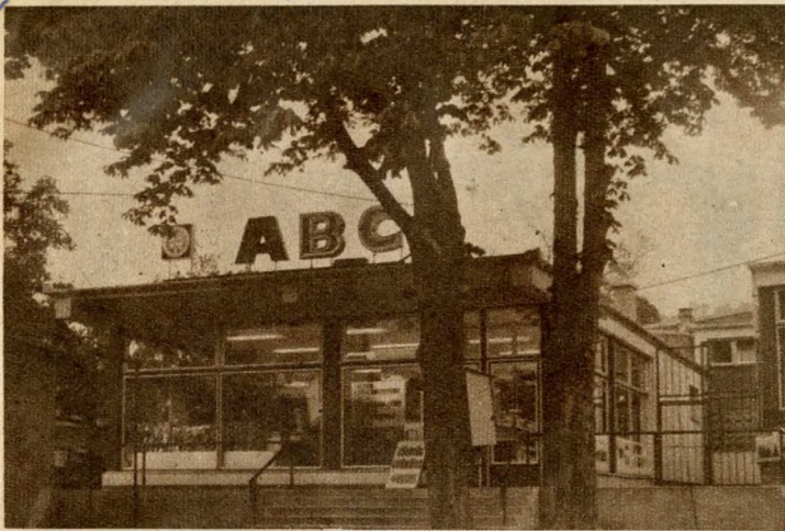
A Sarvas Gábor úti ABC-áruház