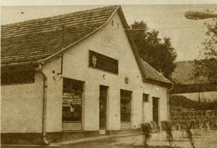
A pestihegykúti Ördögárok Bisztró