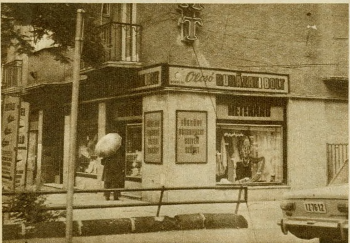
A Böszörményi úti ruházati bolt