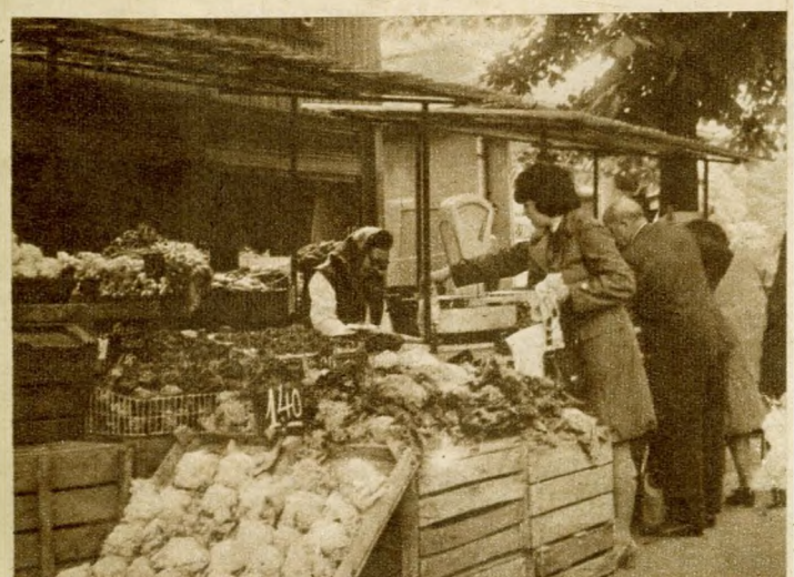
A Budagyöngye piaci zöldség-gyümölcs bolt