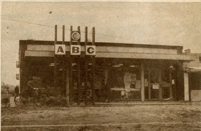
A szövetkezet új ABC-áruháza a Római-parton