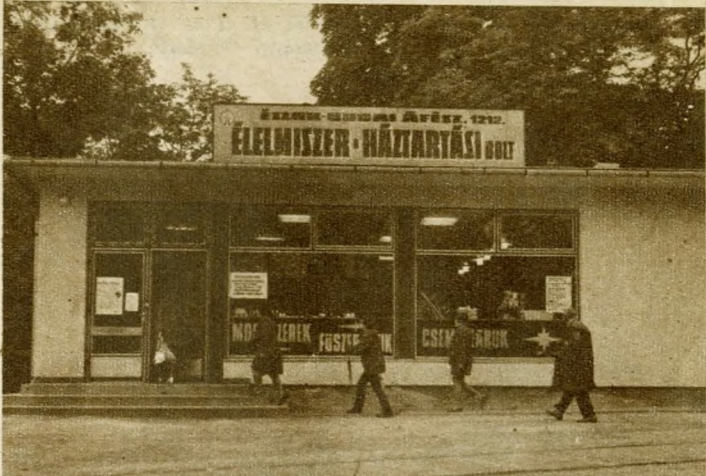
Újjalakított élelmiszer-háztartási bolt a Zugligeti úton