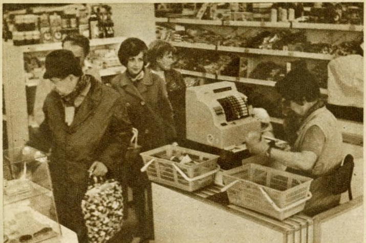
Részlet a Pusztaszeri úti ABC-áruházból