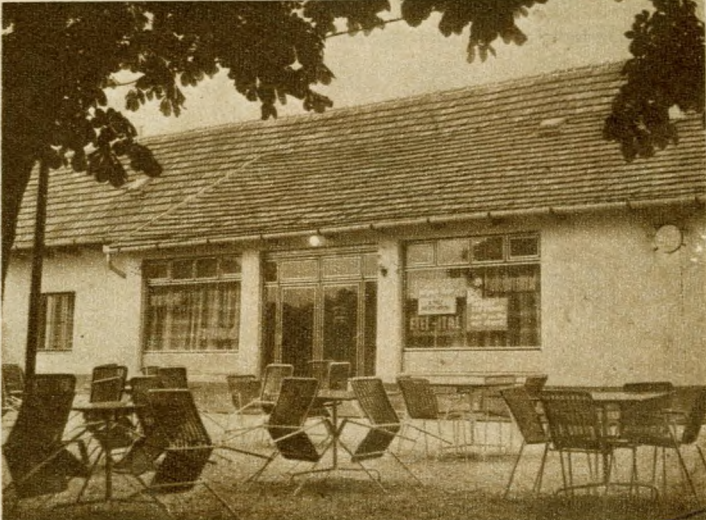
A pestihegykúti Ördögárok Étterem