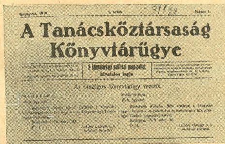
»A Tanácsköztársaság Könyvtárügye.« A könyvtárügyi politikai megbízottak lapja 1919-ből