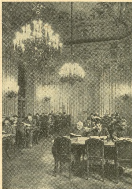
A Fővárosi Szabó Ervin Könyvtár központjának nagy olvasóterme

Végül is Szabó Ervin a nagy könyvtárpalota nélkül is elérte célját: megteremtette a magyar megfelelőjét annak a nagyvárosi nyilvános könyvtárnak, amely központi könyvtárában sokrévű igényel számot vető tudományos könyvanyaggal.