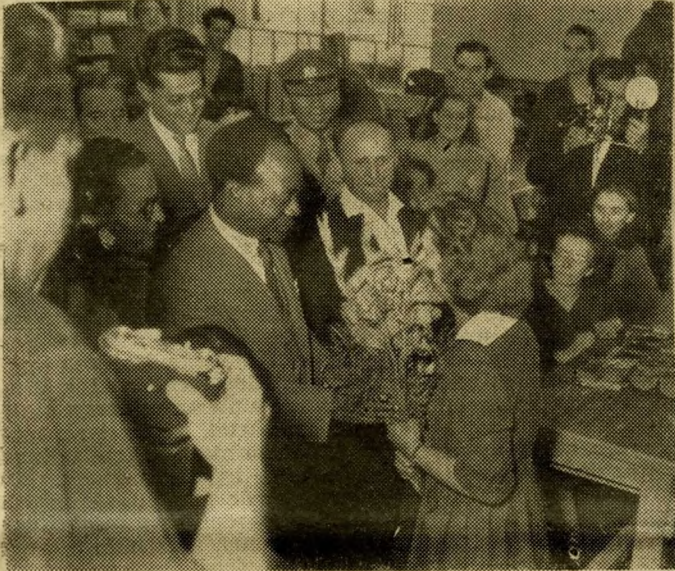
A névnap virág az elnöké lesz

Búcsúzókor munkáskül- döttség vette körül a gyár kapujában Nkrumah elnö- köt. „A Beloiannisz-gyá- riak legjobb kívánságait küldik a ghanai népek” — mondták búcsúzóul kedves vendégünknek, Nkrumah el- nöknek.