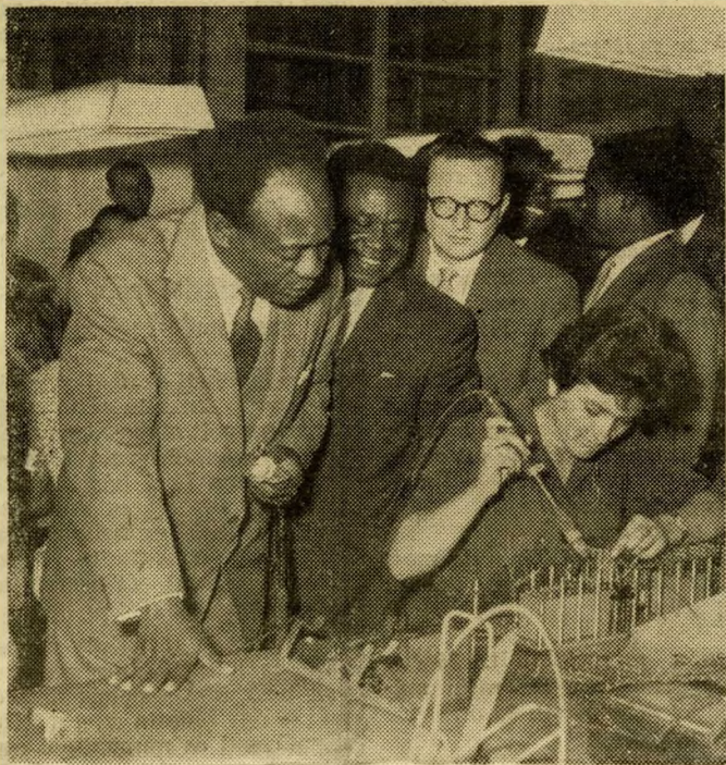
Az érdeklődés pergőtüzében

Innen a 44. műhelybe vitt az elnök és kíséretének útja. Ott is több nődolgozóval vál- tottak szót, s műszaki vonat- kozású kérdéseket tettek fel a szakembereknek.