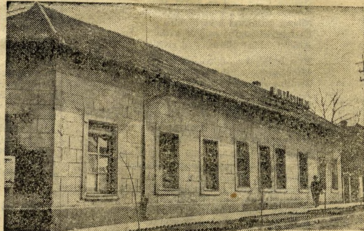
A csepeli öreg munkásotthon.

volt 1918—19-ben az Országház tér. Két köztársaságot kiáltottak ki ezen a téren. Az elsőt, a polgári köztársaságot az Országház lépcsőjéről 1918. november 16-án. A másodikat, az igazit, a nép hatalmát, a Tanácsköztársaságot az Országházzal szemben magasló Földművelésügyi Minisztérium erkélyéről hirdették ki 1919. március 23-án.