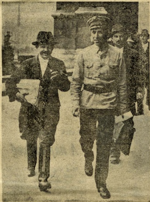
Nyisztor György és Szamuely Tibor az Országház téren 1919 júniusában.

A szomszédok bizonyára azt hitték, hogy afféle vasárnapi terefere folyik. Nem is sejtették, hogy tőzszomszédságukban az újkori magyar történelem egyik legnagyobb eseménye megy végbe. A Kelen-lakás ven-