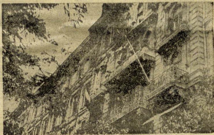
A monitorok ágyútüzétől sérült Szovjet Ház homlokzata.

Budapest kövei mesélnek. Dícső tettekre, nagy eseményekre emlékeznek... H. J. — N. J.