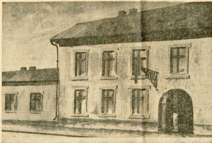
A Hacker Szála az eredeti formájában. (Az épület — némileg átalakítva — ma is megtalálható a VII., Tanács körút 7. szám alatt.)