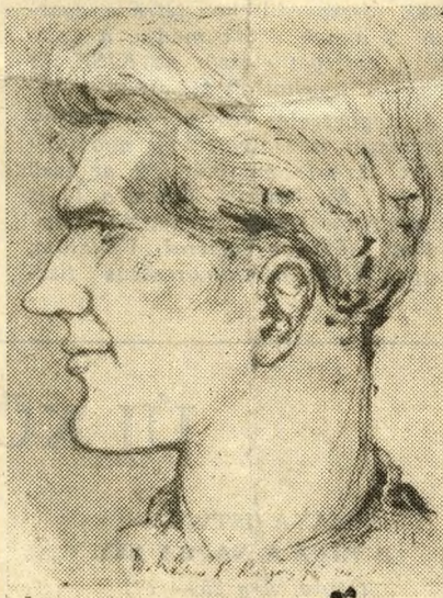
(Mohácsi Regős Ferenc rajza)

Különös társaság — ahogy már említettük — valóban valamennyien „közlegények”. Nincs közöttük pallér, művezető, technikus vagy mérnök. Csak csoportvezető, de az is ugyanúgy dolgozik, mint a többi.