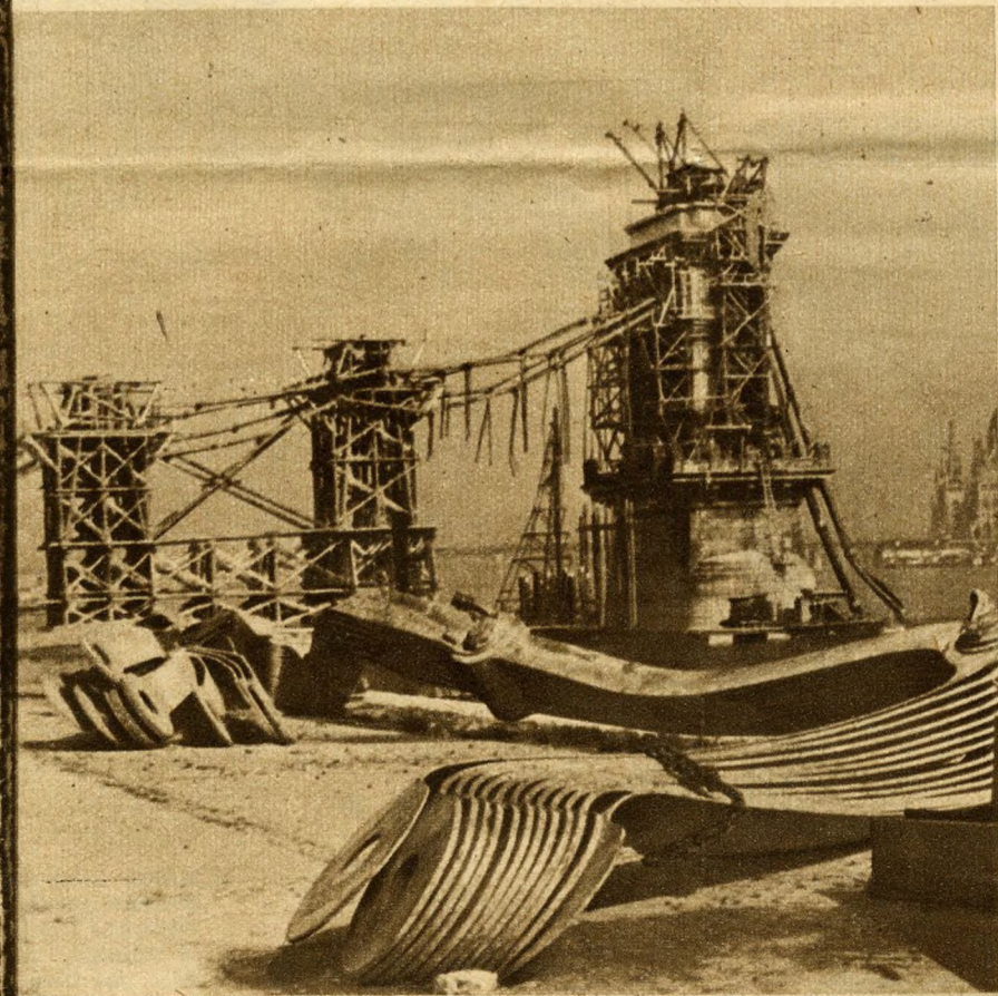
A HÍD LASSAN KIEMELKEDIK HULLÁMSÍRJABÓL...