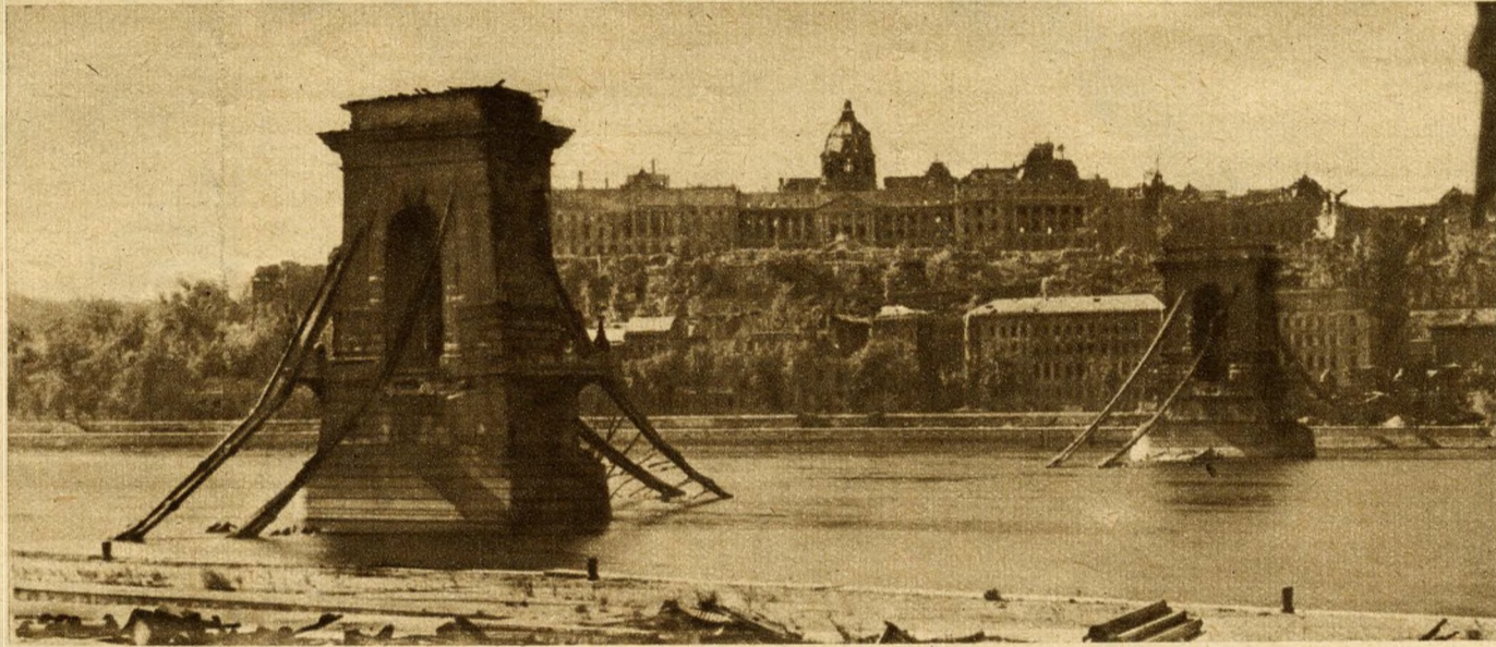
GYILKOSSÁG: a fasiszták Budapest felszabadítása előtt esztelen dühükben felrobbantották a Lánchidat. Mint elhalt karok a nyomorék testen, úgy roskadnak a vízbe a láncszerkezet részei