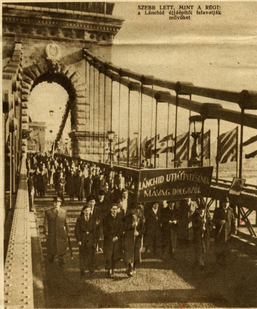
SZEBB LETT, MINT A REGI: a Lánchid újjáépítői felavatják művüket