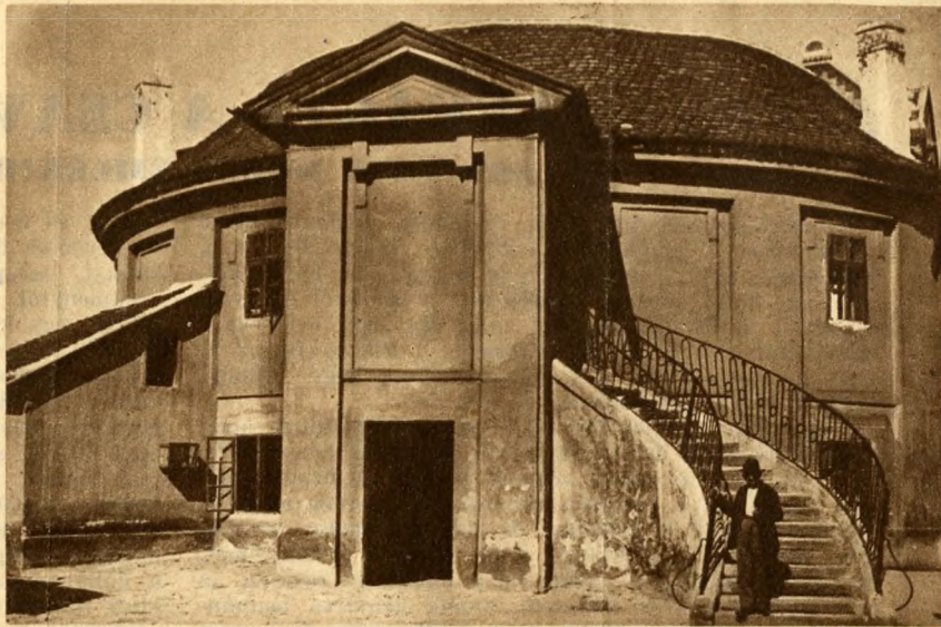
Az óbudai „rondella“ földszinti és emeleti bejárata.

Egy elbeszélés szerint a török hódoltság idejében (1670 körül) valamelyik török fejedelem, Köprülü Mohamed, vagy ennek fia, Achmed szállt meg itt és nyilván hosszabb tartózkodásra, mert röviddel később állítólag háremhölgyeit is idehozatta hazájából. Buda visszafoglalása után kiürült az épület és ekkor kolostorrá lett. Körülbelül 50—60 évig lehetett a szerzetesek otthona. Utána selyemgyárrá alakították, ahol még sok