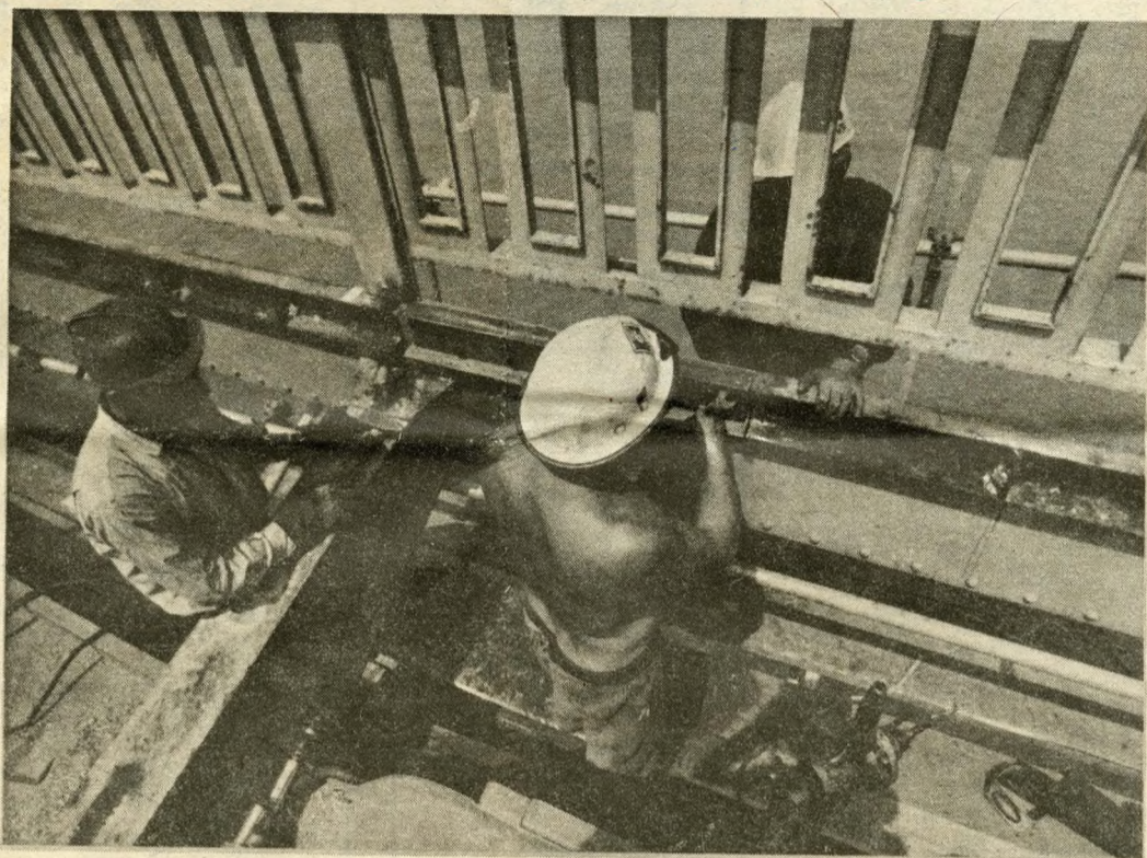
A KÖZGÉP dolgozói a magasban