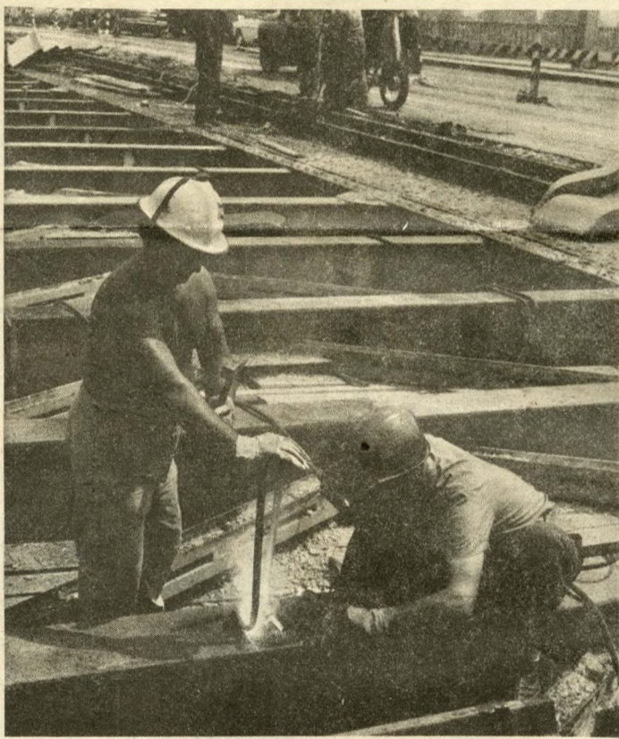
Felújítják az acélszerkezetet

Két műszakban négyszázan dolgoznak a híd felújításán. Heroikus erők vonultak itt fel: az óriás földmunkagépek eddig tízezer köbméter földet mozgattak meg a Boráros téri hídfőnél. Szombaton és vasárnap sincs megállás, mert az idő sürget: a tervek szerint 1980 októberében teljes szélességben megnyílik a híd a forgalom előtt.