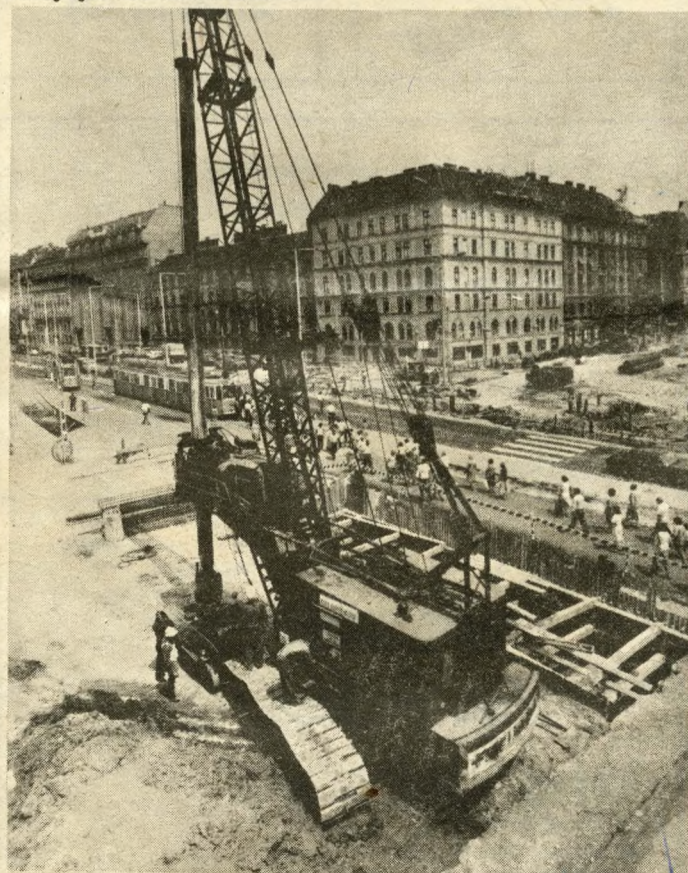
A gépóriások egyike