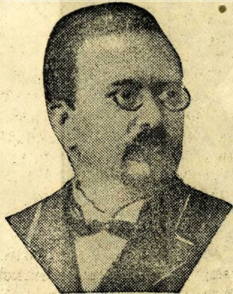
Kaas Ivor báró

lelős szerkesztő, utóbb mint helyettes főszerkesztő, illetve főszerkesztő. Esménye volt egy igazi magyar lap típusa. Csak ez a köntös felelt meg a lap szellemének, céljainak és a művelt magyar közönség kívánalmainak. Azon volt, hogy a szerkesztőség minden egyes tagja beleilleszkedjék a lap hangjába és irányába. Formákat, gondolatokat keresett, melyek a lapot és a közönséget közelebb hozzák egymáshoz. Mindez természetesen Rákosi Jenővel, a lap vezérével tökéletes összhangban történt. A szerkesztés feladata volt, hogy a Rákosi Jenő által megkoncipált keresztény és nemzeti politika a lap minden sorában, minden rovatában érvényesüljön. Ennek a politikának a tartalma, ideológiája egyre bővült, a tartalom gazdagságával lépést tartott a lap terjedelme és folytonos formai megújulása. A véderővita óta a Budapesti Hírlap a magyar közvélemény élén haladt. Olvasóközönsége hirtelen megszorodott, azt lehet mondani, hogy a magyar közönség túlnyomó része pártkülönbség nélkül a Budapesti Hírlap olvasóinak táborába özlött. Pártvezérek, pártok, közönség a felmerült kérdésekben döntőnek tartották a Budapesti Hírlap álláspontját. A vezérszerep, melyet a Budapesti Hírlap a sajtóban magához ragadott, megkövetelte a rendelkezésre álló legkiválóbb újságírók és írók