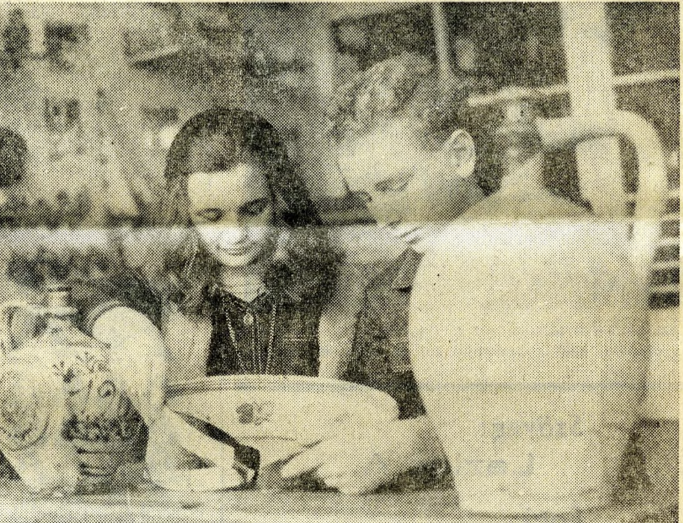
Szakköri foglalkozás a Fővárosi Művelődési Házban

Komarom megyei Nyomda Vállalat Lapnyomdája, Tatabánya.