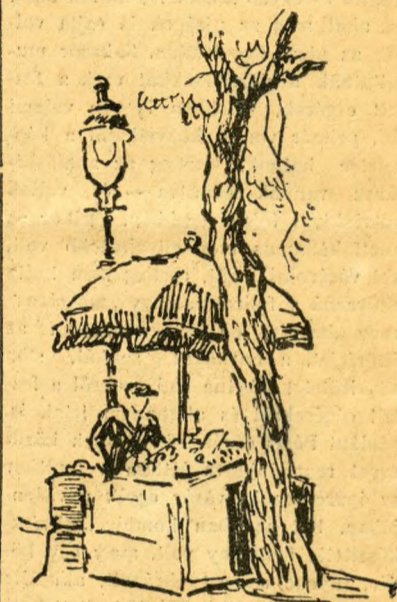
Árus a József-körúton