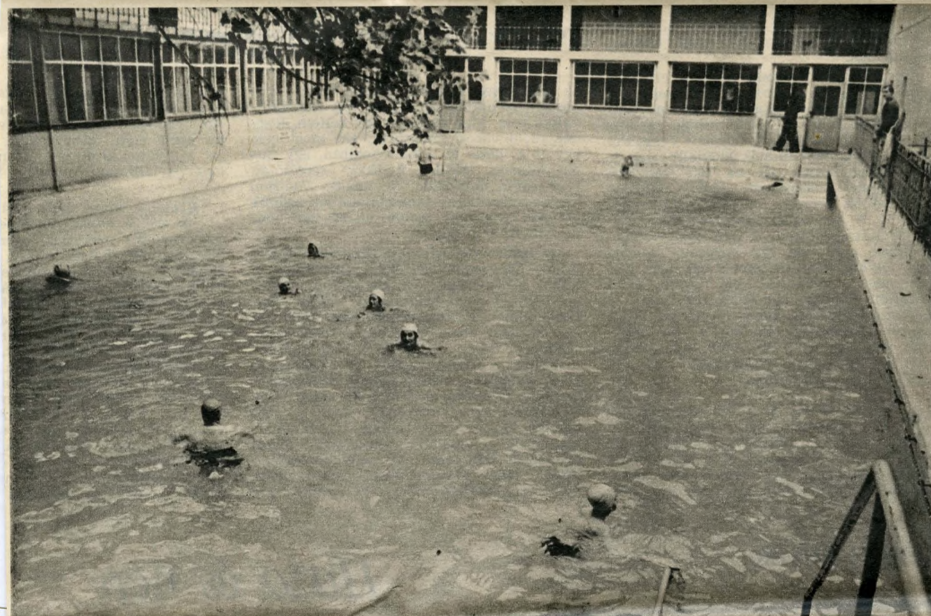
Reggelente törzsvendégek töltik meg a medencét. Lent: A hálás vendégek megemlékezései