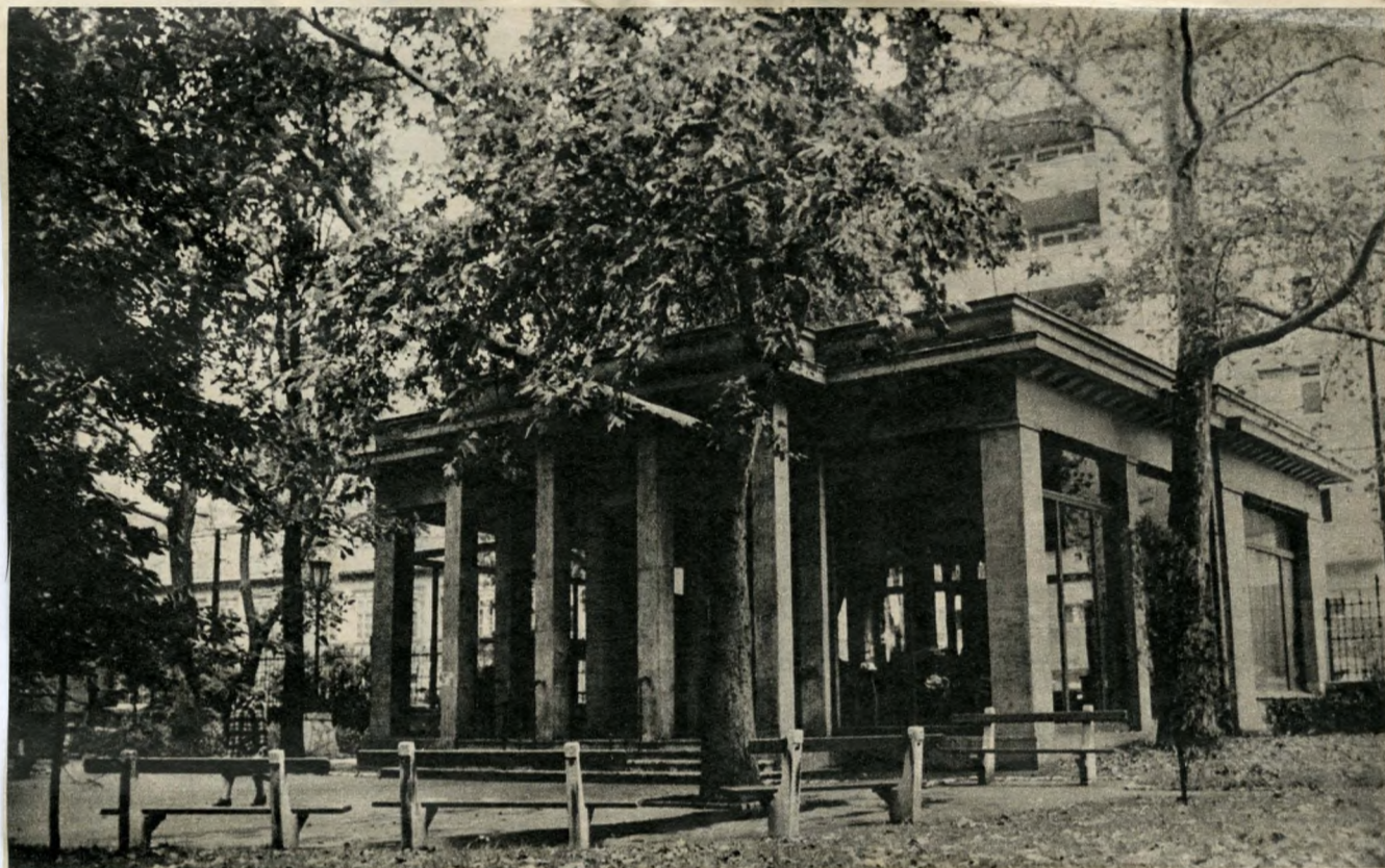
A Lukács fürdő udvara a hatalmas platánfákkal