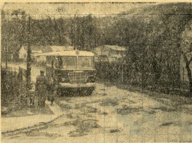
Majdnem járhatatlan a sűrű gödrösödés miatt a Nagyrét utca. Teljes felújításra lenne szükség, hogy a 63-as zavartalanul közlekedhessen, (Pál Miklós felvétele)

A második kerületben a Pasaréti útra panaszkodnak az 5-ös dolgozói. A 91-es járatról a Rommel Flóris utca gödreit teszik szóvá. A pesthidegkúti területéről viszont három