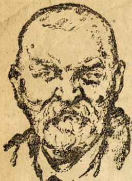
GERLÓCZY KÁROLY 1835 — 1900.

— Adja a mindenható, hogy most, midőn törvényhatósági működésünket megkezdjük, az egyetértés szelleme lobogja át kebleinket, mert csak így tudunk eleget tenni a szent kötelességeknek, amelyek minket a haza és a főváros irányában megilletnek.