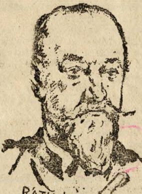
RÁTH KÁROLY. 1821—1897.

aki 209 szavazattal lett Budapest első főpolgármestere