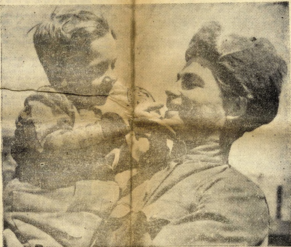
Akik megmentették gyermekeinket