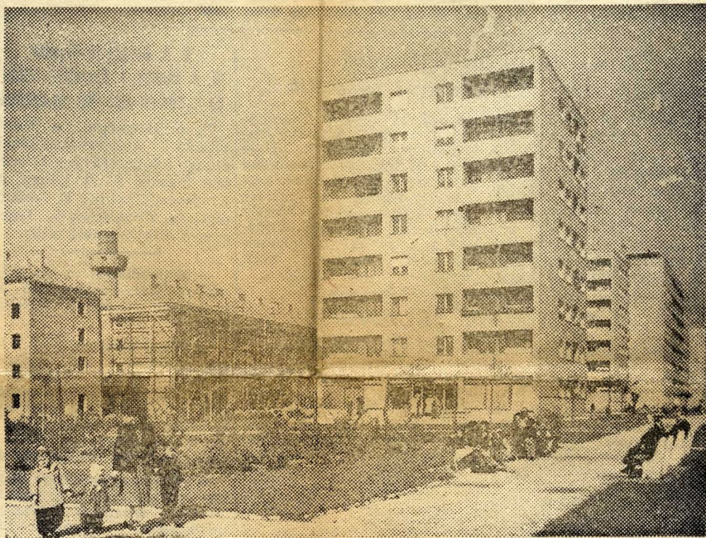
A Béke úti új házak egyik csoportja