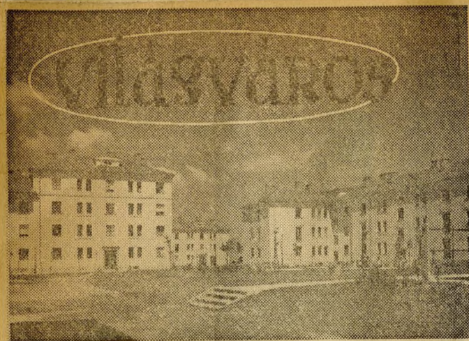
Uj épületek a Nagy Lajos-király úton