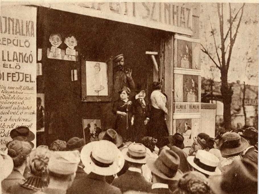
Az ingyen-publikum hallgatja a kikiáltót. Alsó kép: legszebb emlék egy gyorsfénykép.