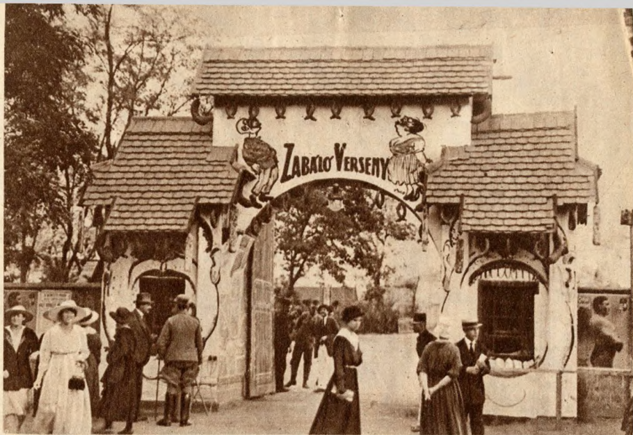
A legnépszerűbb mulatságok egyike volt a „zabáló-verseny”.