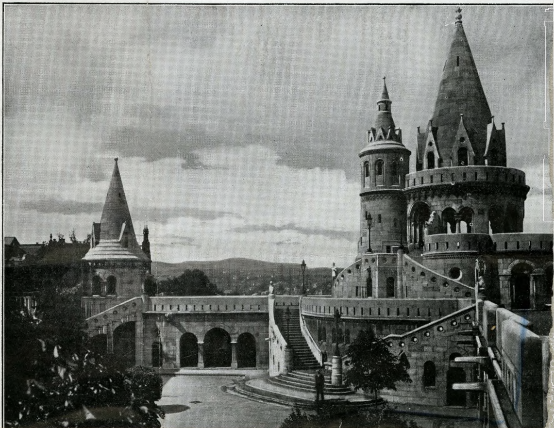
Il Bastione dei Pescatori.