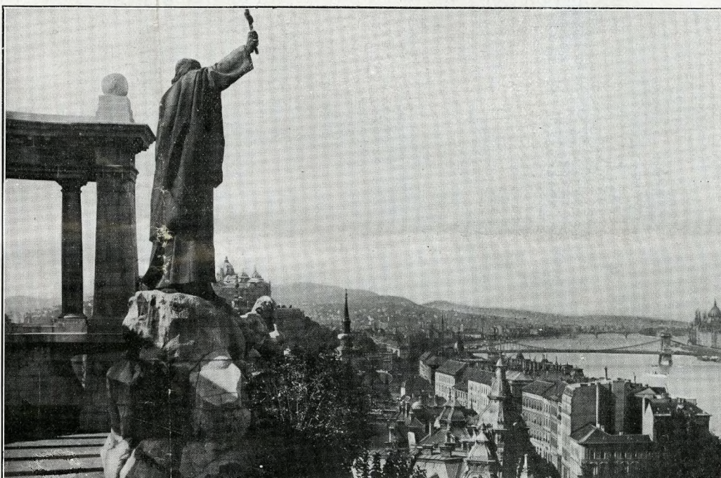
Blocksberg (Buda) col monumento a San Gerardo.