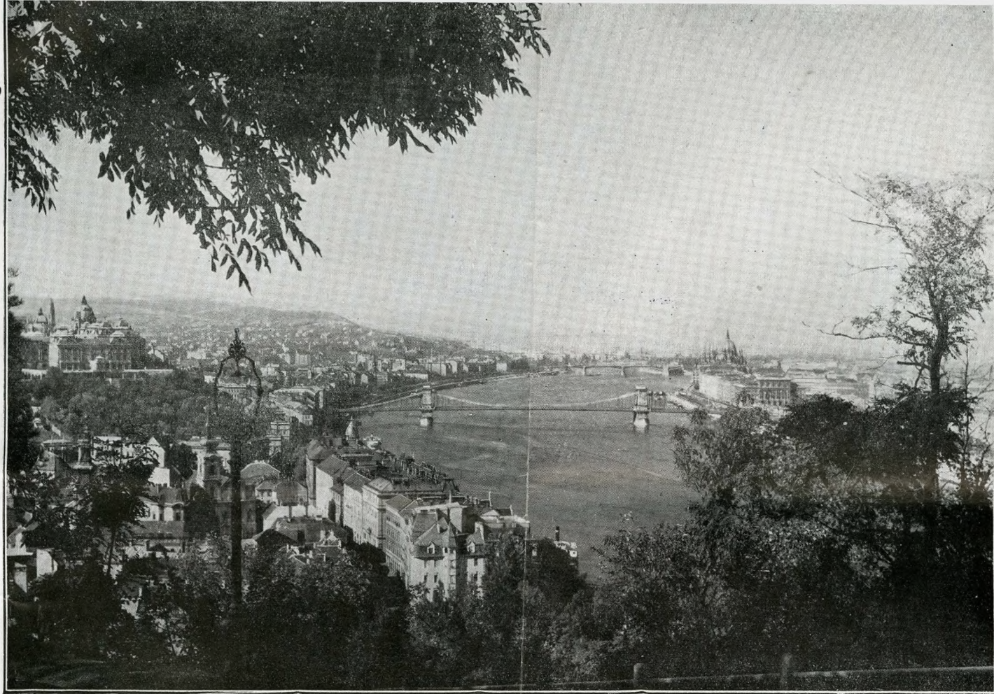
Il meraviglioso panorama di Budapest.

linconia della Jugoslavia, ove le foreste dagli abeti altissimi si alternano a lande incolte dove gli armenti magri e dispersi pascolano in praterie acquitrinose nelle quali si specchia la tragica immobilità di un cielo azzurro di vetro, valicata la frontiera, sostava il treno ad una stazioncina. Piccola stazione e piccolo nome di poche sillabe, che in breve saranno dimenticati, succhiati dall'onda piena delle sensazioni più vive.