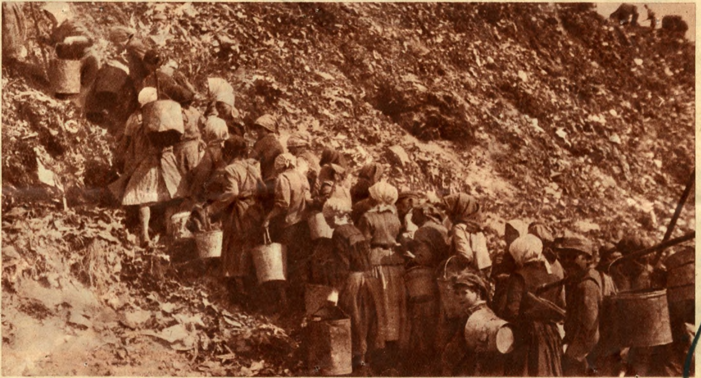
Guberálók megrohanják a szemétheget.

A vonat csak a hegy lábáig tud menni. Itt lekapcsolják a kocsikat és a két mozdony négyesével viszi fel a hegytetőre a szemetet. Itt ürtik ki a vagónokat. Szemétország lakói már éhes szemekkel, türelmetlenül várakoznak, hogy mikor kerül rájuk a sor. Mert Szemétországnak külön polgárai is vannak, akik itt élnek és halnak, stílusosan, mert a házaikat, illetve viskóikat is szemből épí-