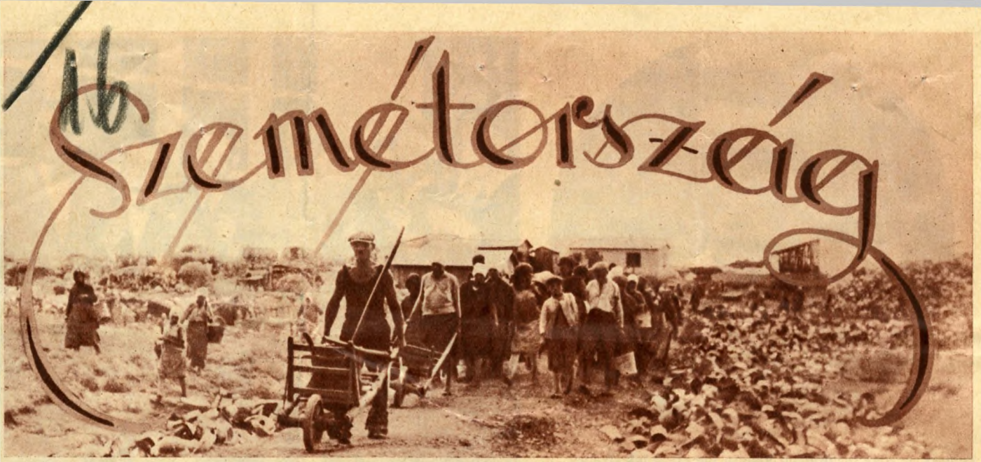
Jönnek a guberálók.

Harmincegy vagón szemet utazik különvonaton a Szemét Eldorádohá — Kincsek a hulladék-hegy gyomrában — Az éhes „guberáló” megeszi a hulladékban talált húst — A monoklis báró is felesapott guberálónak