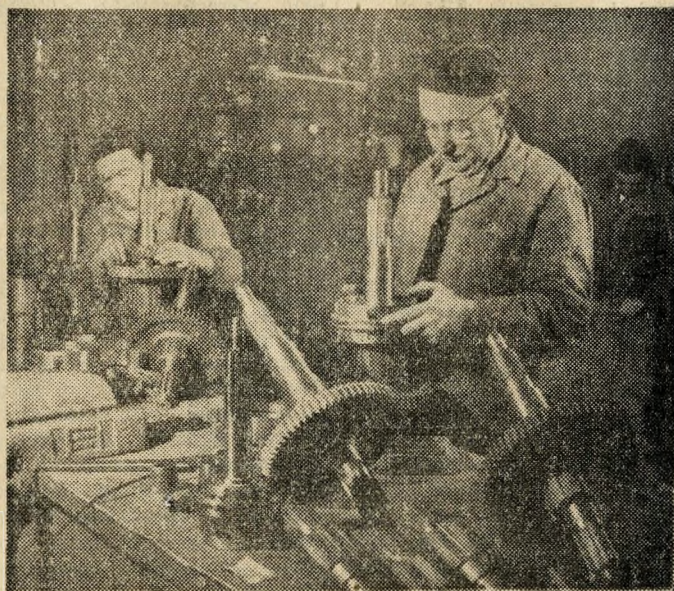
Az Autó- és Traktoralkatrész Gyárban összeillesztik a sebességváltók fogaskerekeit.

Április 4-ig húsz új óriásbuszt ad át az Ikarus felhívására az Autóbuszüzemnek négy nagyüzem. A felajánlás pontos teljesítésére már készülnek az alkatrészek. A Csepel Autógyár motorgyárában a szerelőszalagnál dolgozó KISZ-brigád tagjai elhatározták, hogy március 10-i határidő helyett — tervén felül — még februárban elkészítik a felajánlott húsz motort. A tizenkettedik darabot már szerelik.