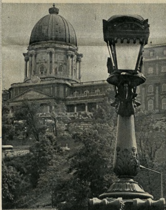
Öntöttvas lámpa a királyi palota alatt

Megfiatalodva áll újra a közlekedés szolgálatában Budapest legrégebbi hídja, a Lánchíd és a Várhegy alatt húzódó Alagút. A főváros egyik közlekedési és idegenforgalmi csomópontját tizenkét vállalat — köztük egy osztrák — varázsolta újjá. Az Alagút új fehér és világoskék mozaikburkolatot és nagyteljesítményű szellőztető berendezéseket kapott, a hidat újjáfestették, és felújították a világítási berendezéseket is.