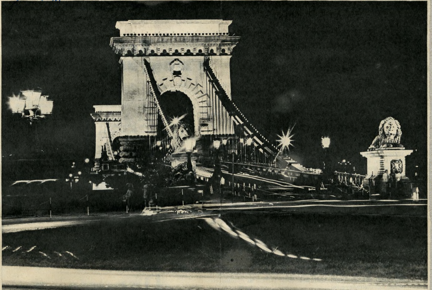
Ésti díszvilágításban a Lánchíd