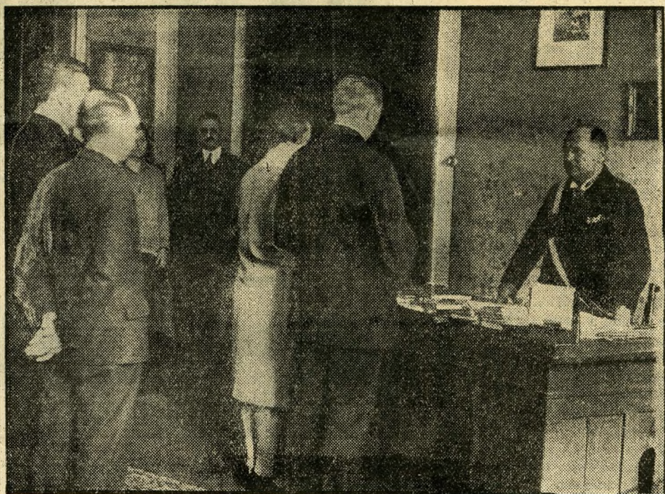
Ahol a házasságokat kötik