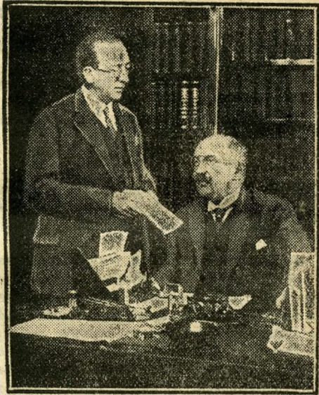
Az előljáró és helyettese

16 Ebben a néhány sorban nem a Budapesti városházáról lesz szó, mely a maga hatalmas arányaival és magasabbrendű városigazgatási feladatainak természeténél fogva sokkal inkább tarthatna igényt a megyeház elnevezésre, ha vidéki polgárral akarnám érke-