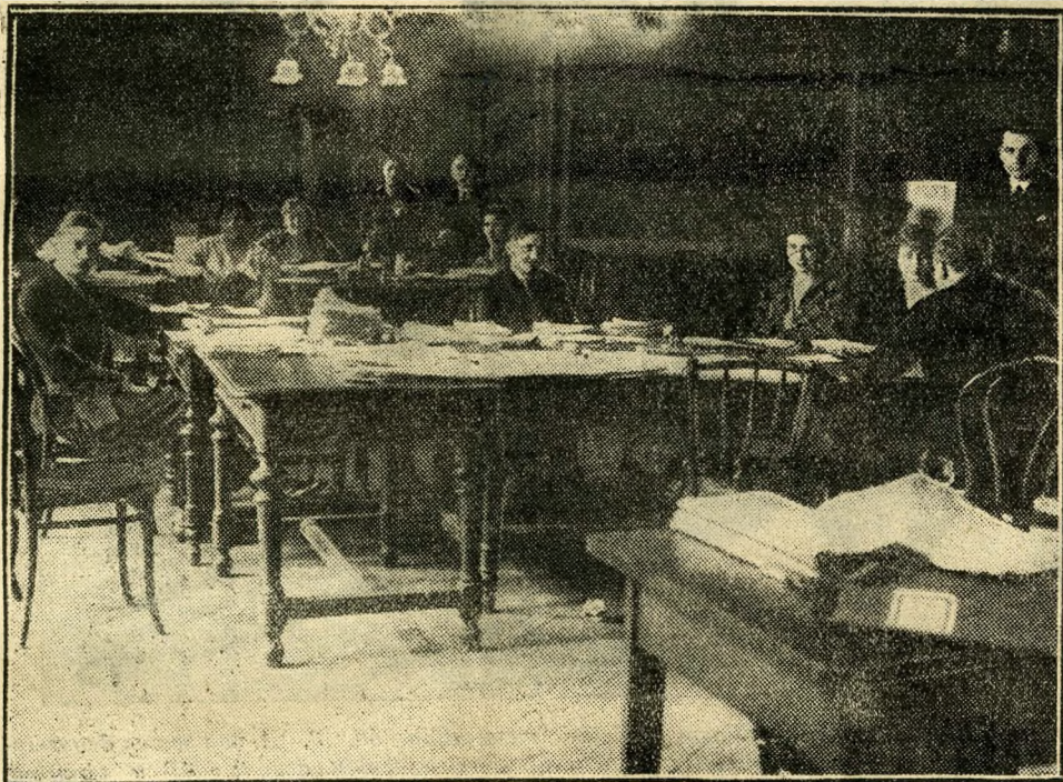
Az előljáróság „vándormadarai”

A hárominstanciás fogalmazó elé ilyen delikvens került egy napon, ujone még a maga vizező szakmájában, a kihágási nyilván-tartóban addig még elő nem fordult fiatal falusi menyecske. A fogalmazó, aki nem szor-rette, ha megfelebbezik az ítéleteit, mert ez számára tetemes munkatöbbletet jelentett, aggodva vizsgálta a még ismeretlen terhel-