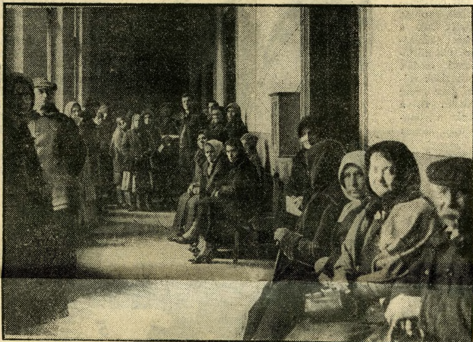
Segélyszállításra várnak a szegények

nem kell bemutatni a közönségnek: ismeri ezeket és valljuk be, nem túlságosan lelkesedik értük. A szintén eléggé ismert kezelőhivatalok látogatottságával vetekedő nagy forgalmat bonyolít le minden kerületben a bizonyítványos és a munkakönyves. Az előbbi a szegénységi és mindenfajta helyhatósági bizonyítványok kiállítója, az utóbbi a gyári lányok és a kereskedőtanonok munkakönyv-kibocsátó és ellenőrző hatósági közege. A városbíró az úgynevezett bagatel-követelések bírói fóruma, az anyakönyvi hivatal eleven közigazgatási cáfolata annak az állításnak, mely szerint a házasságok az égen köttetnek. Az állat-orvost a lovak eltűntével a kutyák mentik meg attól, hogy fölösleges anakronizmussá válják. Egy jövendőjén aggodalmaskodó állatorvost ilyképpen vizsgálatgatott tréfáskedvű fogalmazó-kartársai: — Hát bizony az autó lassan el fog temetni